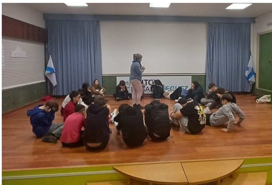
Dinamización del taller “ Que me dá paz? ” en IES Antón Losada, A Estrada

Este taller dio lugar a resultados interesantes