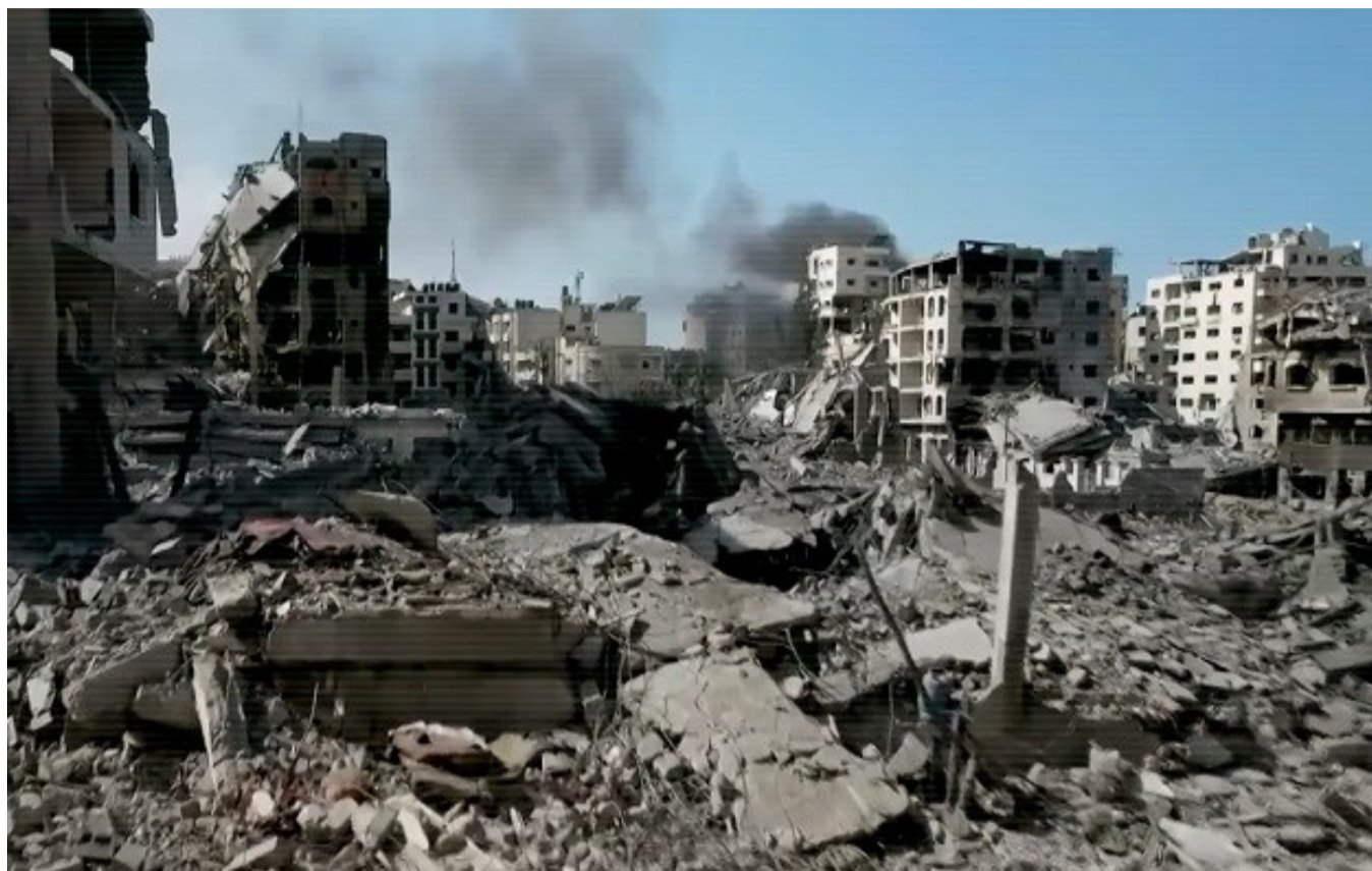
Captura del video realizado por nuestra socia PSCCW (Psychosocial Counseling Center for Women) sobre la actual situación en Gaza.

Pero las violaciones nunca cesaron. El 2 de marzo, Israel cerró todos los pasos fronterizos para