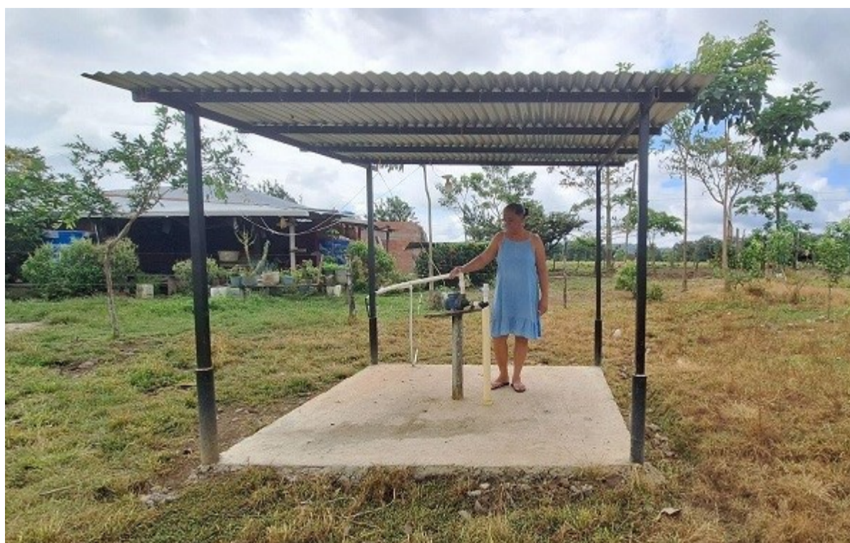
Uno de los pozos en la comunidad de Tumaradá

En lo que respecta al acceso a agua potable, se han perforado 12 pozos con sistemas que cuentan con bombas hidráulicas para la extracción del agua y pozos protegidos con su respectivo techo, garantizando así la durabilidad de todo el conjunto. Además, se han instalado sistemas de bombeo conectados a tanques de almacenamiento en las distintas viviendas, lo que permite un acceso más sencillo y seguro a este recurso,