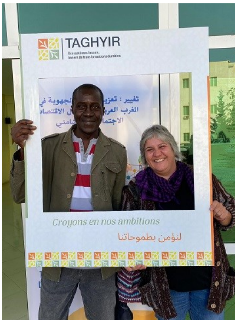
Participantes de REAS Balears en el Encuentro Internacional de ESS del proyecto TAGHYIR

El último día nos desplazamos a la localidad Barkane, donde visitamos una cooperativa de productos de agricultura ecológica, una tienda de comercio justo y el mecanismo de promoción de la ESS. La Casa de la Cooperativa de Berkane , que así se llama, trabaja para promover el cooperativismo a través de la formación y el refuerzo de las capacidades, el acompañamiento y apoyo a cooperativas. Están creando un espacio para la comercialización conjunta de productos de cooperativas artesanales y agroalimentarias, ya que la dispersión territorial de éstas dificulta sus canales de comercialización. Los dispositivos de esta maison cooperativa nos recuerda a los ateneos cooperativos catalanes... ¡no podemos de-