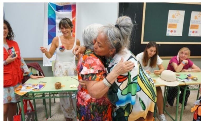
Momentos de la actividad desarrollada en el marco de Barrios Abiertos

nocer importantes iniciativas locales mallorquinas que el plantan cara, como el trabajo en Economía Social y Solidaria de la Fundación Deixalles y sus tiendas de productos de segunda mano, la iniciativa Koluté de Cáritas (un taller de producción textil para personas en situación de vulnerabilidad) o las tiendas de comercio justo s'Altra Senalla y Shikamoo .