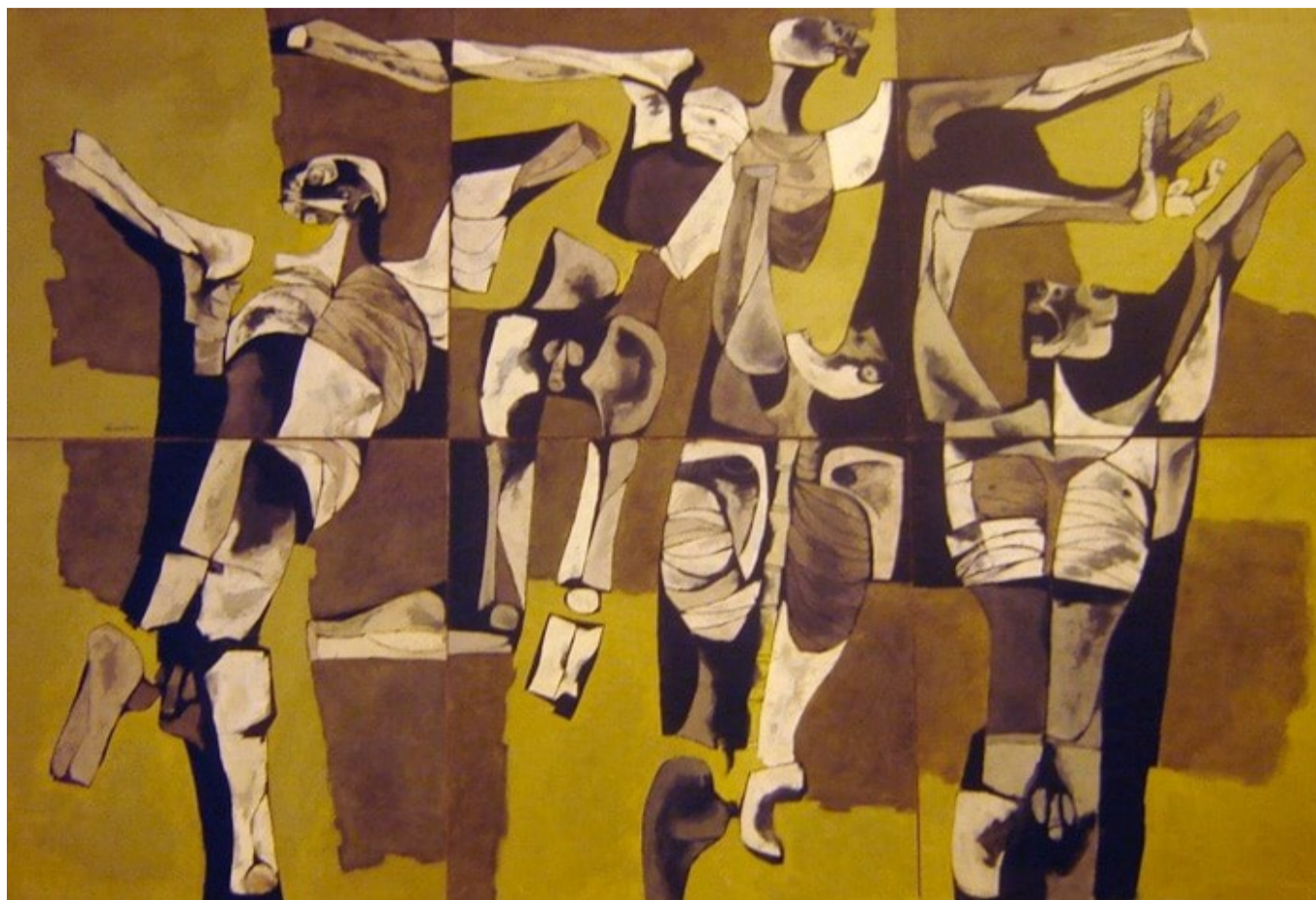
Los Mutilados. Oswaldo Guayasamín, 1976

Una oportunidad que ha de aprovechar el momento en que las pistolas callan porque la historia recuerda que estos silencios de las armas se han utilizado con frecuencia para un rearme que recrudeció la violencia posterior, para un descanso paralelo de contendientes extenua-