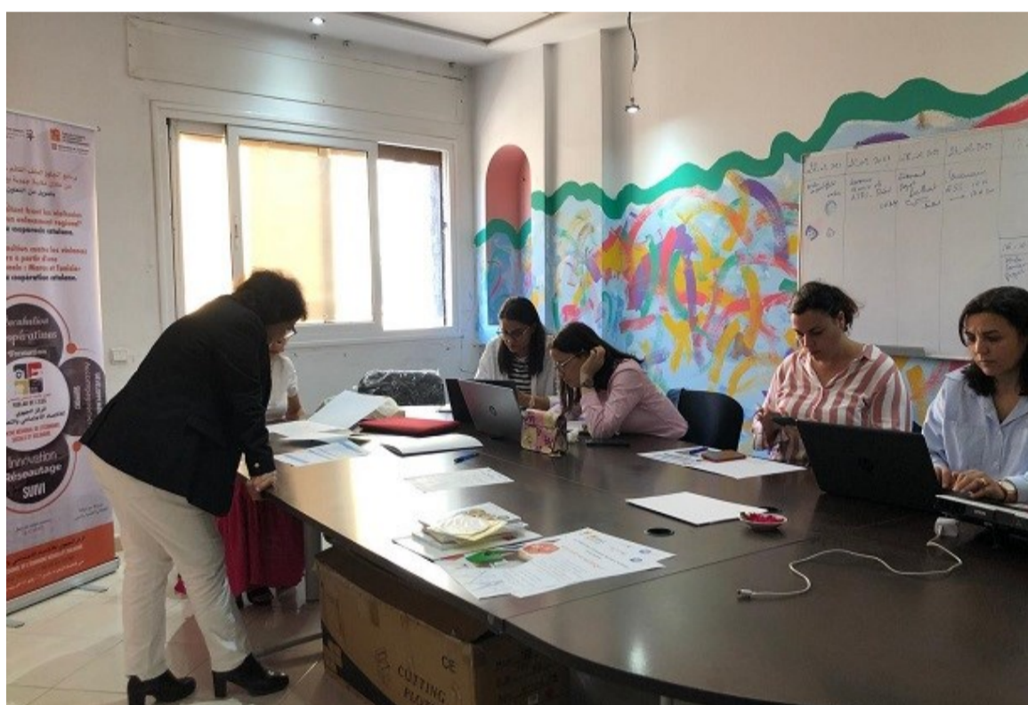
La TAMSS y la UAF durante el intercambio en Tánger.

En Túnez, TAMSS tiene mucha experiencia en la protección de las mujeres supervivientes de violencia basada en género gracias a la activación de un centro de primera atención y a la gestión de dos centros de acogida en distintas regiones del país. Uno de ellos, el Centro El Amen de Sidi Thabet, una estructura que el Ministerio de la Mujer cede en gestión a la sociedad civil, es un centro que ACPP apoya desde el 2018 con el objetivo de capacitar y reforzar al personal de acompañamiento, de aumentar las actividades formativas dirigidas a las mujeres acogidas y de mejorar la calidad de su estructura. Ahora, junto a TAMSS, ACPP ha promovido la elaboración de un estudio de sostenibilidad del centro, para la puesta en marcha de estrategias y actividades que, a largo plazo, puedan hacer de este centro