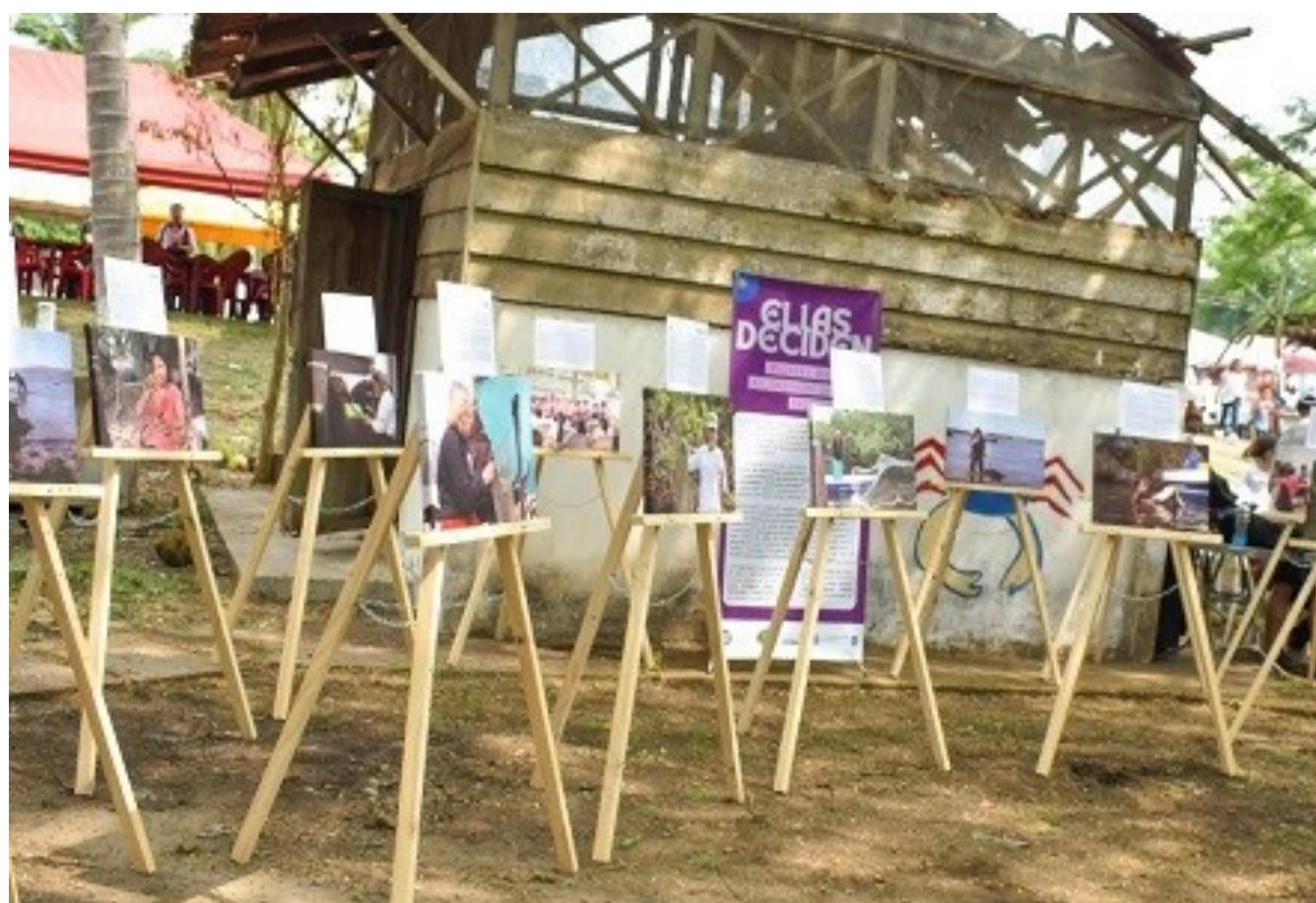
La exposición "Elas Deciden" en el Festival del Cangrejo en Tecoluca (El Salvador)

En el caso de El Salvador, la exposición ha tenido una notable presencia en diversos eventos culturales. Inició el 26 de mayo en el Festival del Cangrejo en Tecoluca, San Vicente, donde más de 5000 personas celebraron la gastronomía del cangrejo y la labor del sector pesquero artesanal. Posteriormente, el 26 de julio, se presentó en el Encuentro EnREDarnos en la ciudad de San Salvador, un evento que destacó propuestas artísticas lideradas por mujeres en teatro, música, audiovisual y fotografía. Su recorrido continuó el 5 de septiembre en el Festival de la Juventud de La Paz Centro y el 10 de octubre en el muelle de San Luis La Herradura en el marco del Festival Municipal del Día del Pescador. Durante los próximos meses, la muestra se presentará en diferentes espacios relacionados con el sector pesquero artesanal, ampliando así su impac-