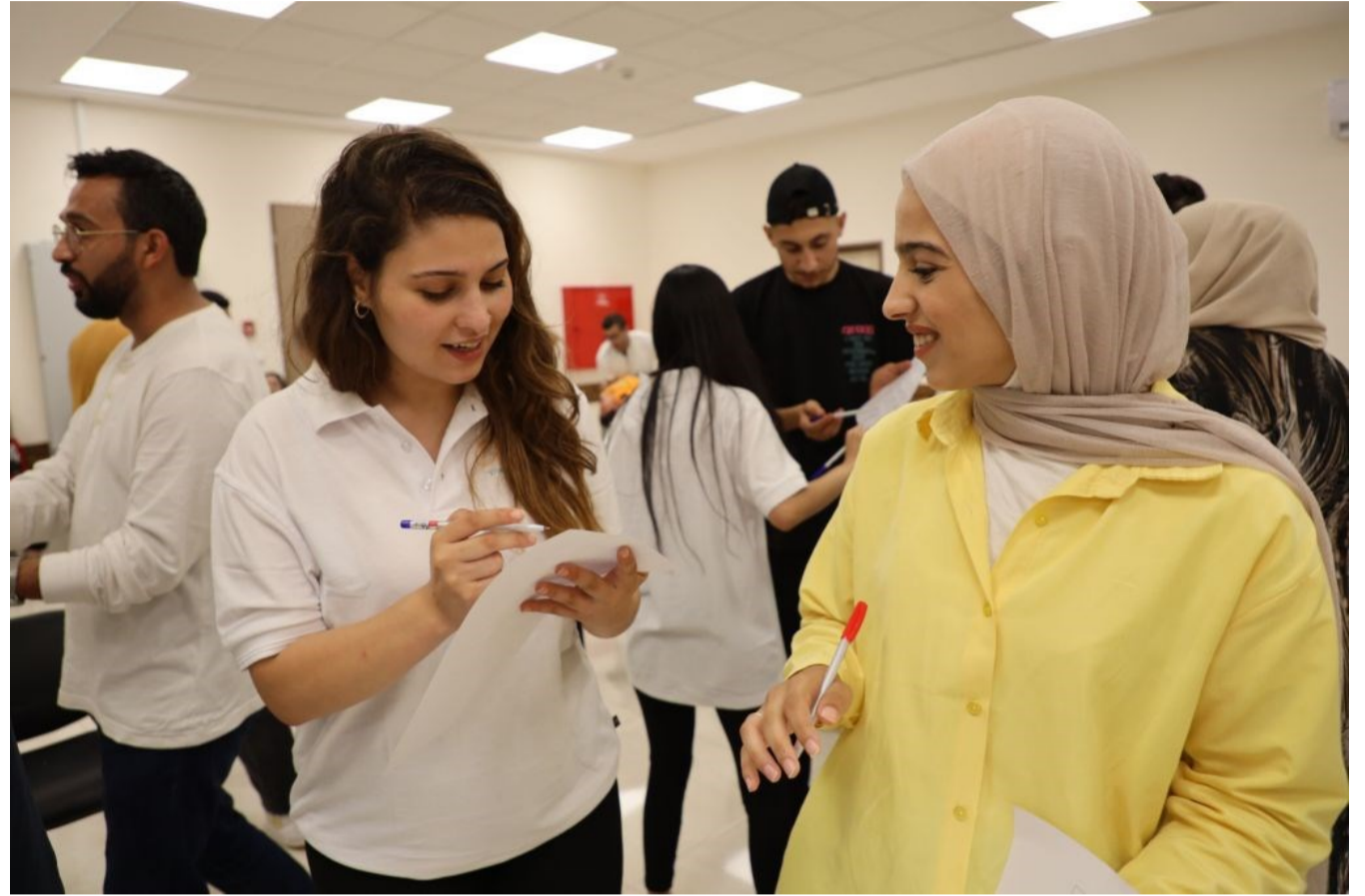
Actividad de REFORM en el marco del proyecto "Acción liderada por jóvenes"

Para promover esta visión, trabajamos para empoderar a jóvenes y mujeres para que desempeñen roles activos en la vida pública, abogando por una sociedad más inclusiva donde sus voces sean escuchadas. A través de nuestro Programa de Diversidad y Cohesión , y usando nuestra metodología "Facilitando la reforma", trabajamos con grupos marginados —en particular jóvenes y mujeres— ayudándolos a ver la diversidad como una fortaleza en vez de una barrera. Generamos espacios donde pueden aprender unos de otros, gestionar diferencias y forjar lazos que crucen fronteras sociales. A través del análisis de las dinámicas de poder que generan