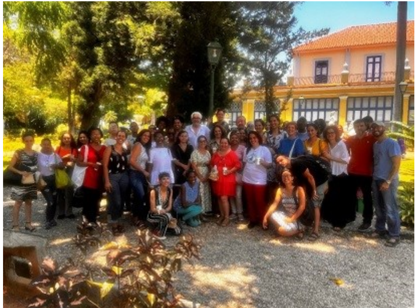
Emprendedoras participantes en la Formación Economía Circular

Con el proyecto se han desarrollado formaciones en energías limpias, se está creando un sistema de movilidad e interpretación inclusiva que facilitará el acceso de los programas educativos a todas las personas, independientemente de si presentan una discapacidad, y se está pro-