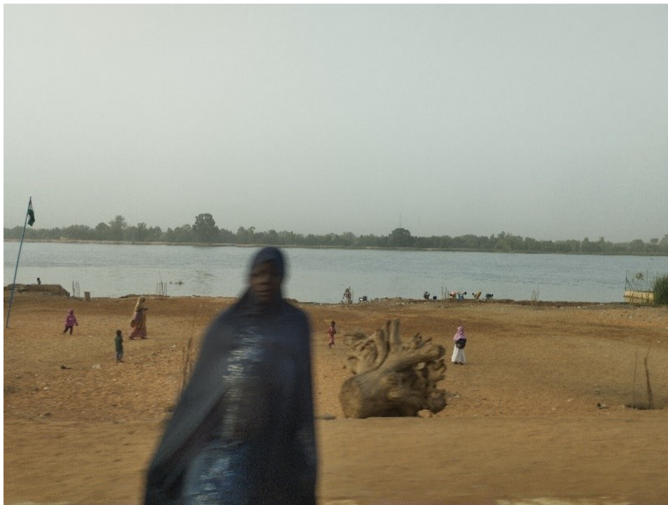
Río Níger a su paso por Niamey.

La creciente influencia de Rusia en Níger tras la expulsión de los militares franceses y los intereses económicos y geoestratégicos en este país, rico en uranio y pieza clave en la política migratoria de externalización del control de fronteras de la Unión Europea o la lucha contra el avance del yihadismo en el Sahel, también determinaron la respuesta de la comunidad internacional. Algunos países donantes decidieron suspender