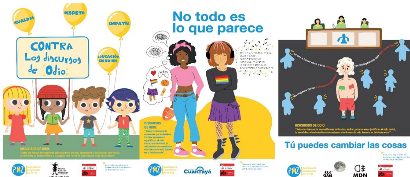
Carteles realizados por jóvenes de las organizaciones juveniles participantes en el proyecto.

En el proyecto participaron tres organizaciones juveniles, Mar de Niebla, Abierto hasta el Amanecer y la Asociación CuanTayá, y la ejecución de esta iniciativa se desarrolló en varias fases de trabajo, como la difusión de una campaña de sensibilización en la ciudad de Gijón, donde los jóvenes de las entidades arriba nombradas, crearon carteles con mensajes clave para con-