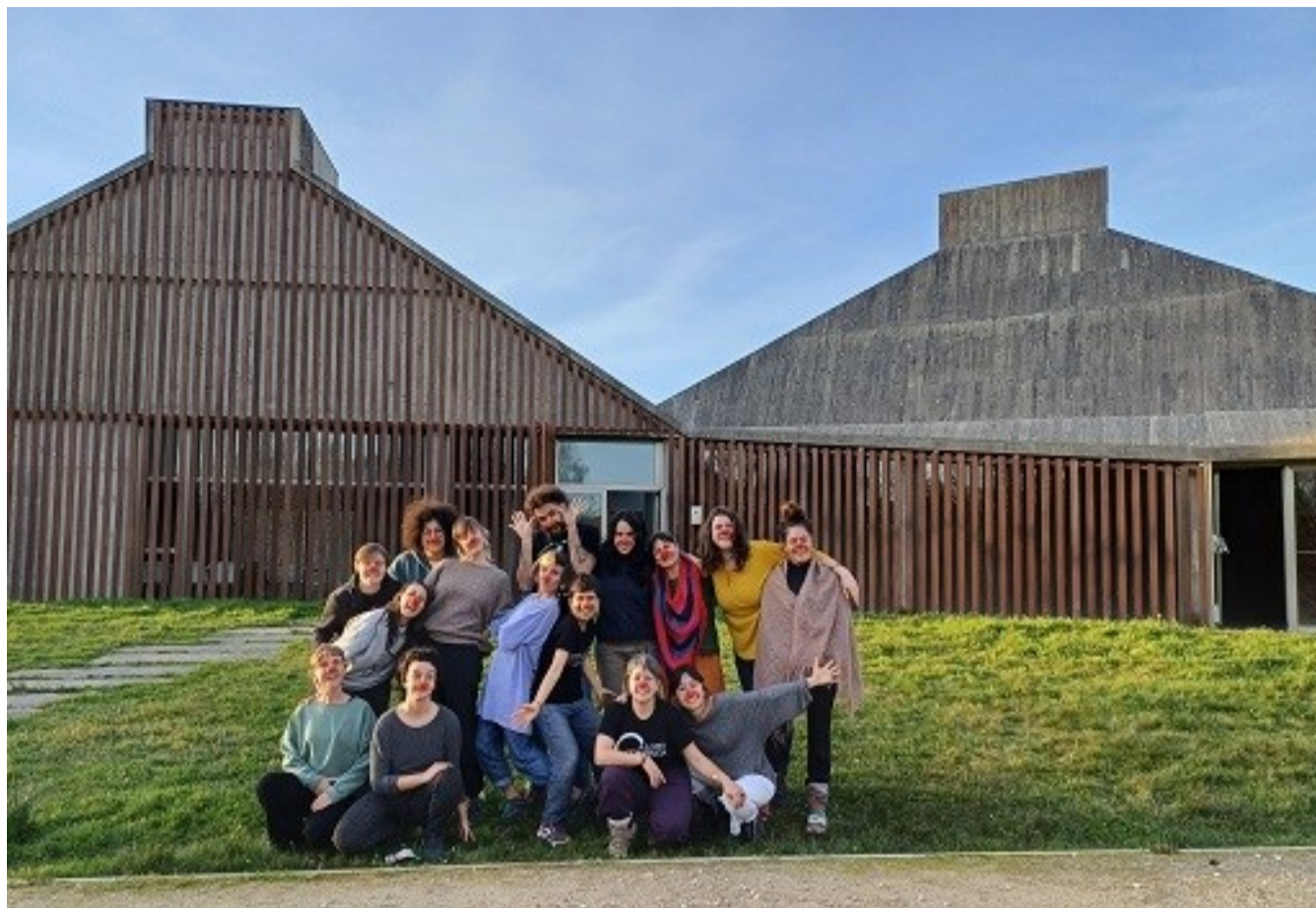
Participantes en la formación frente el Centro Etnográfico Río Mandeo, en Teixeira.

El gran potencial de mostrar la vulnerabilidad a