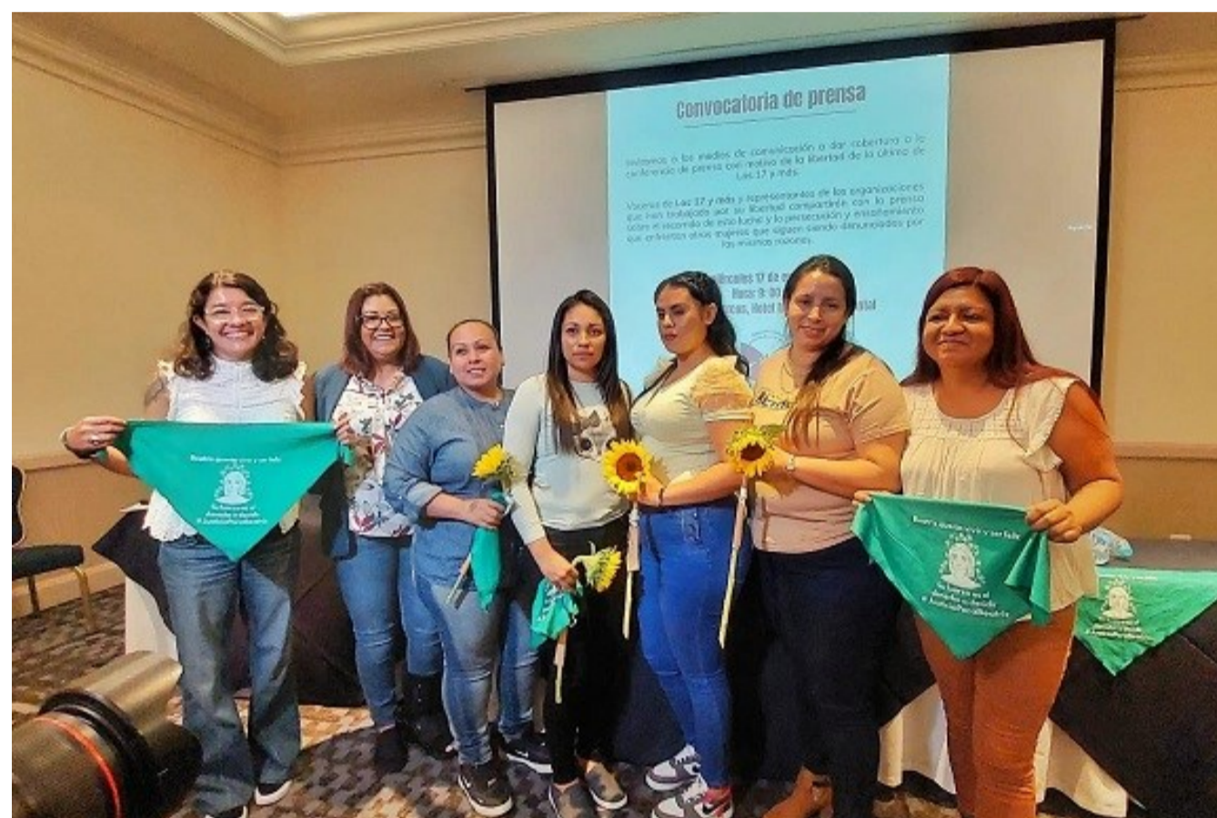
Agrupación Ciudadana por la Despenalización del Aborto

En este contexto violatorio de los derechos humanos de las mujeres, ACPP trabaja desde el año 2016 con la Agrupación Ciudadana por la Despenalización del Aborto , organización salvadoreña referente en la defensa legal de mujeres que han sido condenadas o están siendo acusadas de abortos, emergencias obstétricas o delitos relacionados, que promueve cambios en la legislación actual y que divulga a nivel social la necesidad de asistencia adecuada en materia de salud sexual y reproductiva, tejiendo redes de apoyo, sororidad y colaboración a nivel nacional e internacional y que, entre otros hitos, cuenta con la presentación ante la Corte Interamericana de Derechos Humanos del caso Beatriz vs El Sal-