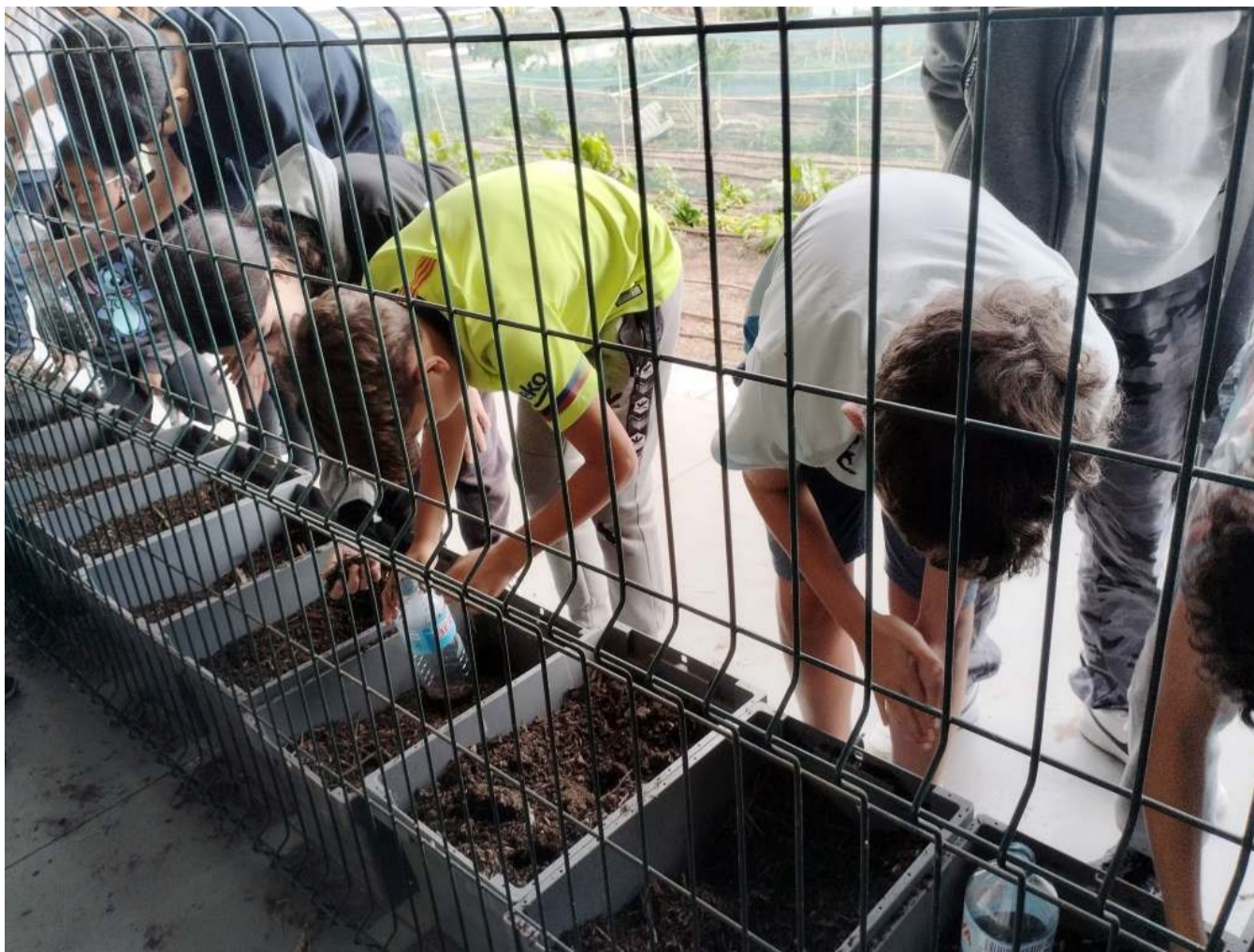
Visita del alumnado del Institut 9 al huerto urbano instalado en la cubierta del Mercado de la Vall d'Hebrón

el compostaje obtenido en el mismo espacio, a partir de la recogida de residuos orgánicos en el barrio.