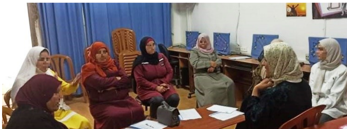
Mujeres de Haris participantes de sesiones de apoyo psicosocial y legal

En este contexto de conflicto y grave vulneración de derechos, nuestras organizaciones socias, tanto palestinas como israelíes, siguen trabajando de manera coordinada para la protección y la defensa de los derechos y dignidad de la población palestina. En concreto, la organización Psycho-Social Counselling Center for Women (PSCCW) –Centro de Asesoramiento Psicosocial para Mujeres, presta apoyo psicosocial y legal a mujeres en varias localizaciones de Cisjordania, entre ellas la comunidad de Haris, en el gobernadorado de Salfit, en el marco del proyecto Mitigación del impacto de violaciones del derecho internacio-