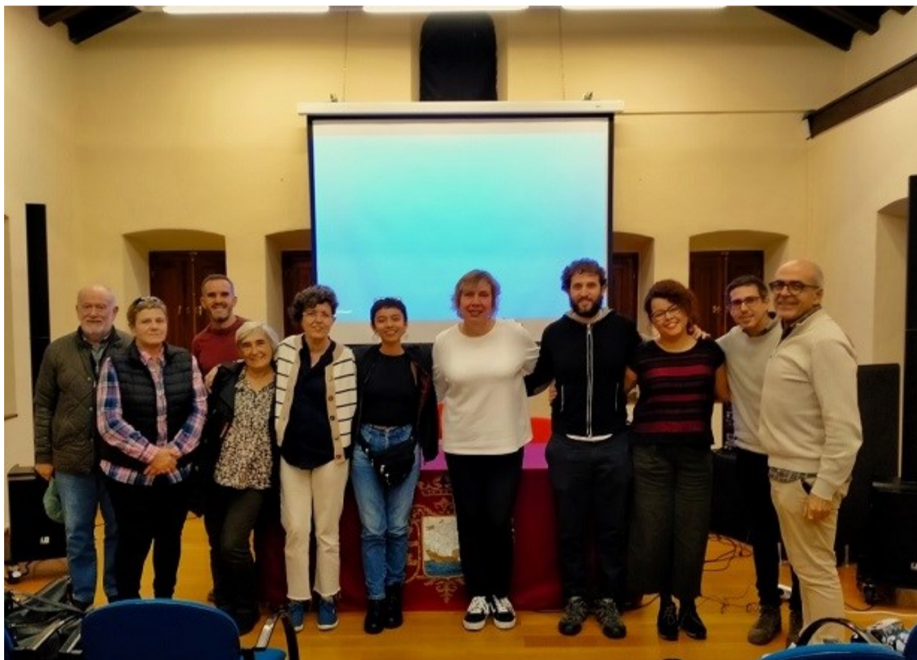
Primera sesión del Cine Fórum con la presencia de defensora salvadoreña, Concejala de Igualdad y Equipo del área de Servicios Sociales e Igualdad y Área de Participación Ciudadana del Ayuntamiento de Portugalete.

En estos encuentros de solidaridad y sororidad entre pueblos y mujeres, la ciudadanía pudo ser consciente de la vulneración de derechos que