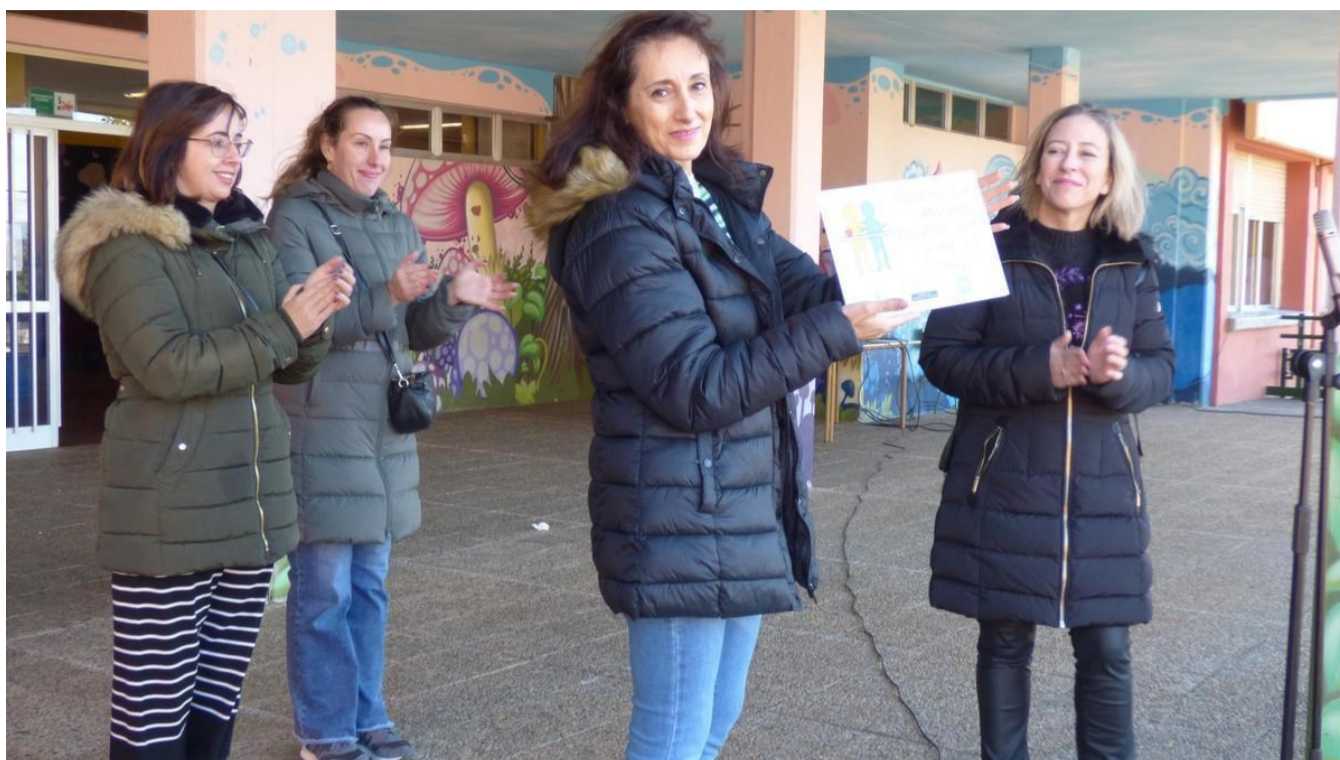
Entrega de la placa ESR, EPD a la Directora del CEIP El Pascón

Todo este trabajo por parte del profesorado y