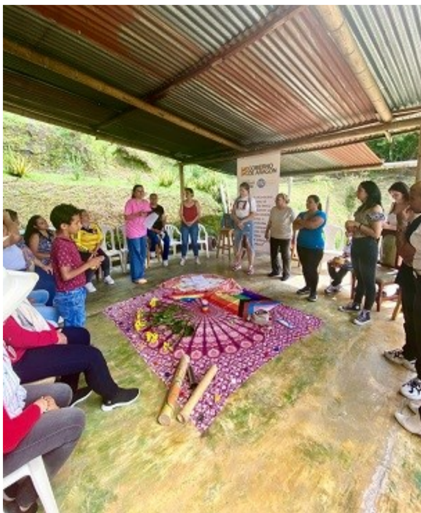
Actividad del proyecto de ACPP Aragón para contribuir al proceso de acceso al derecho a la tierra, a un medioambiente sano y al empoderamiento y acceso a oportunidades de mujeres campesinas y población LGBTI en Marinilla.

Tras salir de la ciudad y recorrer varios kilómetros por el Oriente antioqueño, llegamos a San Rafael, Marinilla y Guatapé, tres municipios en los que se está ejecutando un proyecto de ACPP Aragón. En estos lugares participamos en distintas actividades dentro del marco del proyecto relacionadas con el arte-terapia, el emprendimiento y la agroecología, a través de las cuales se busca contribuir