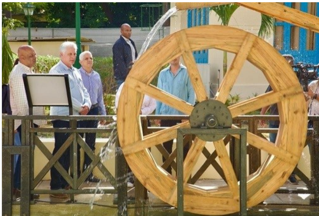
Visita del Presidente Díaz Canel al Centro Demostrativo de Referencia de Energías Renovables

El proyecto que acaba de finalizar, con financiación de la Agencia Extremeña de Cooperación Internacional para el Desarrollo AEXCID), ha permitido que el 100% de la energía que se consume en La Quinta se genere a partir de fuentes de energías renovables, concretamente energía fotovoltaica, y ha posibilitado