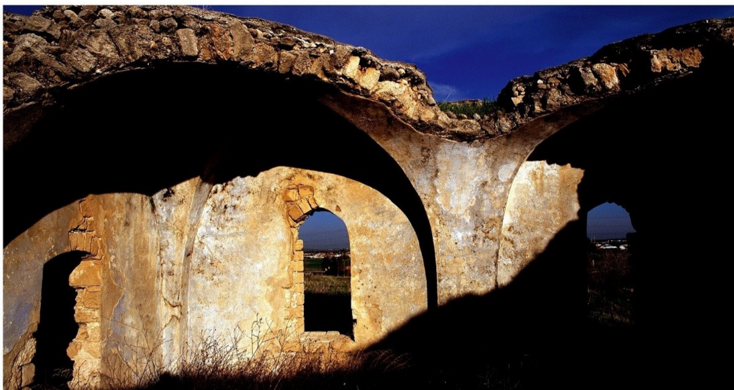
Palestina 2008