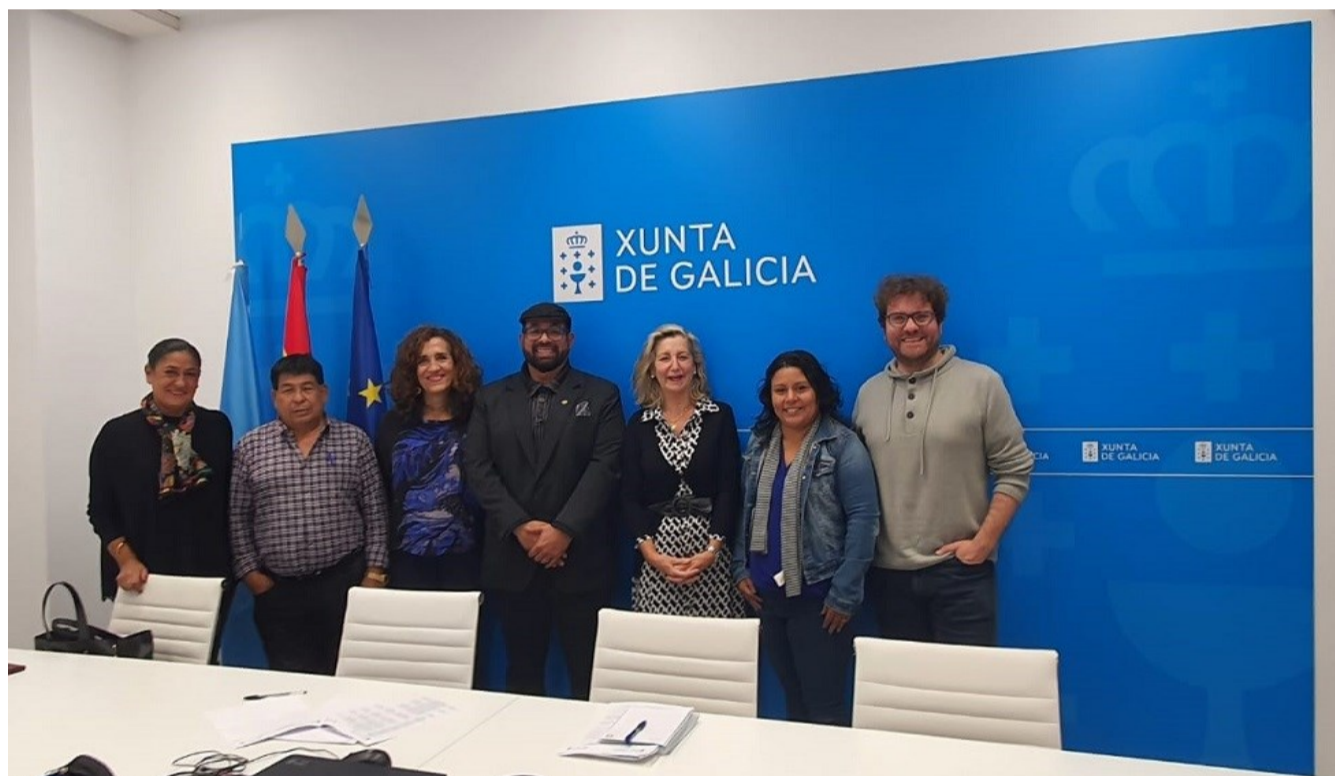
La delegación salvadoreña acompañada por el delegado de ACPP en Galicia tras la reunión mantenida en la Xunta.

Aprendimos sobre embarcaciones tradicionales y nos impresionamos con la defensa del patrimonio cultural marítimo por parte de la Escola de Navegación Tradicional Dorna. Por supuesto, no faltaron momentos y espacios para compartir con los compañeros y compañeras salvadoreñas comidas a orillas de nuestras rías, visitar iconos de nuestra historia cultural y marítima como los Castros de Baroña e intercambiar impresiones durante horas recorriendo las carreteras