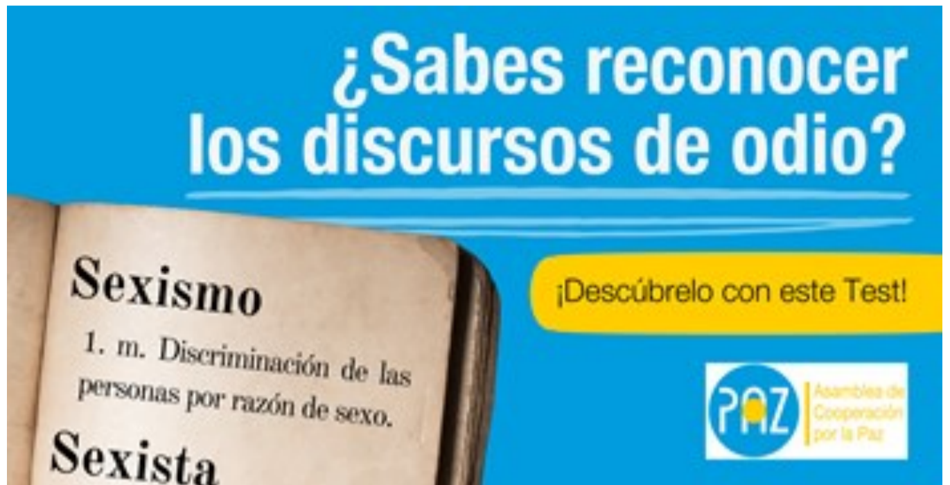
Imagen de la campaña de comunicación estatal.

El “¡Mira tú!”, en euskara “Begira ezazu!”, es un circuito de juegos digital que presenta desafíos al alumnado para que piense por sí mismo acerca de los discursos de odio y la xenofobia. Se pretende que las personas participantes logren