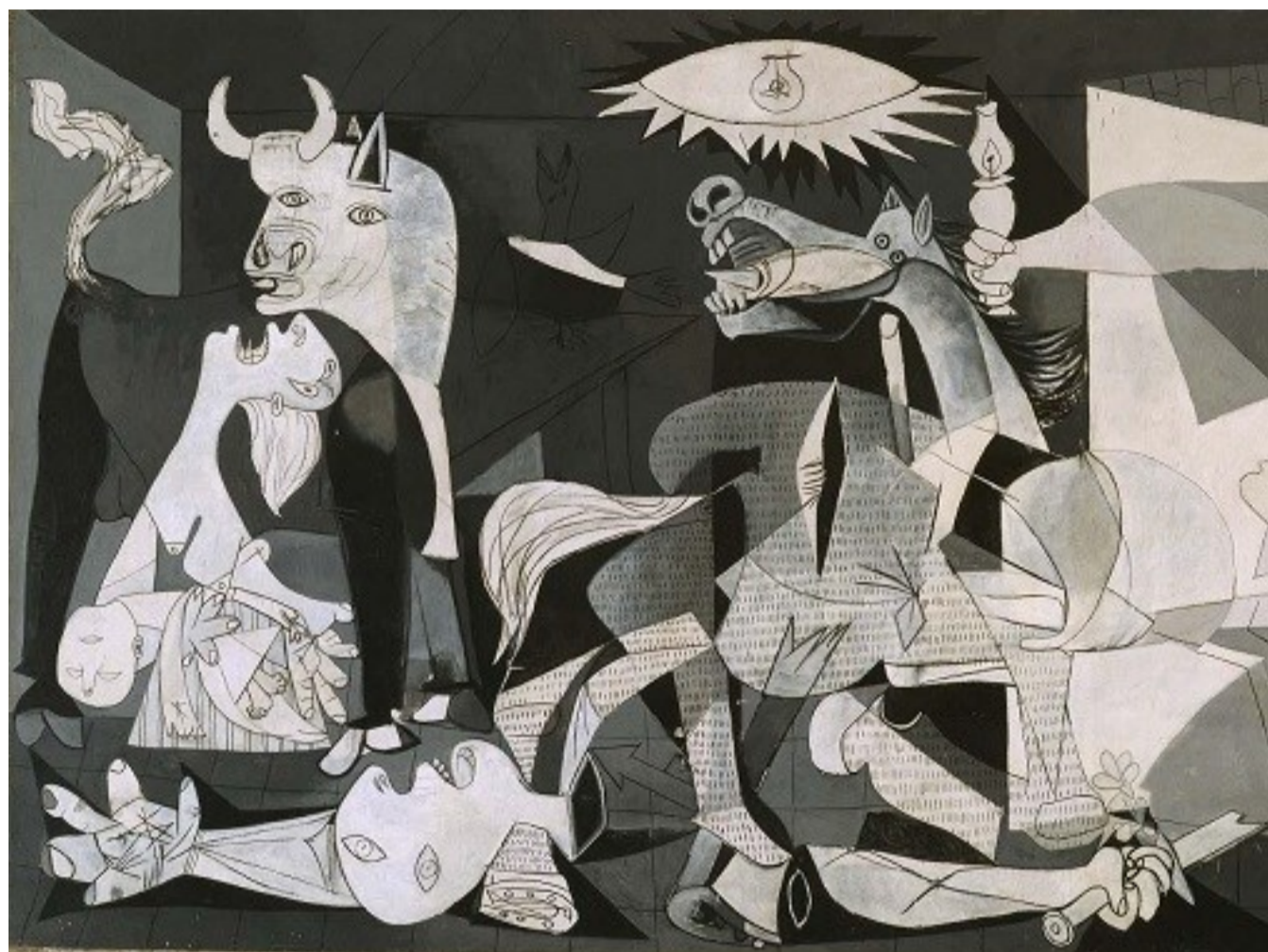
Guernica (detalle). Pablo Picasso, 1937

Un comunicado en el que se condena la respuesta militar del Estado de Israel, una réplica que, asumiendo hechos y palabras, pretende castigar a la población civil de la franja de Gaza, ese pequeño territorio habitado, a modo de cárcel, por dos millones de personas y tiene como objeto incidir en las políticas de ocupación señaladas al principio de este texto: bombardeos recurrentes, cortes de agua y electricidad,