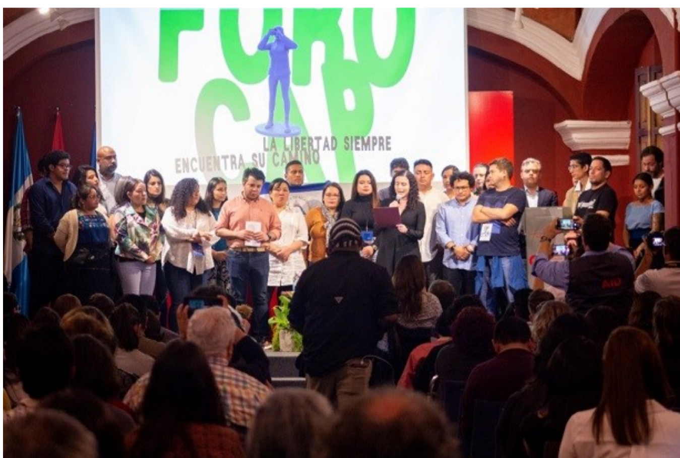
Momento de creación de la Mesa Centroamericana de Periodistas, a la que ACPP fue invitada.

Nayib Bukele capitalizó el malestar general logrando ganar las elecciones en febrero de 2019 en primera vuelta (con más del 50% de los votos), generando ilusión en diversos sectores y movilizándolo a sectores nuevos como la juventud. Después de casi 5 años de gobierno, podemos decir que su pensamiento y dinamismo de gobierno es prácticamente autocrático. Su bandera de gobierno ha sido la “mejora” de la seguridad, aunque para ello haya tenido que hacer desaparecer la independencia de las instituciones 1 , principalmente la justicia, y haya tenido que encarcelar a