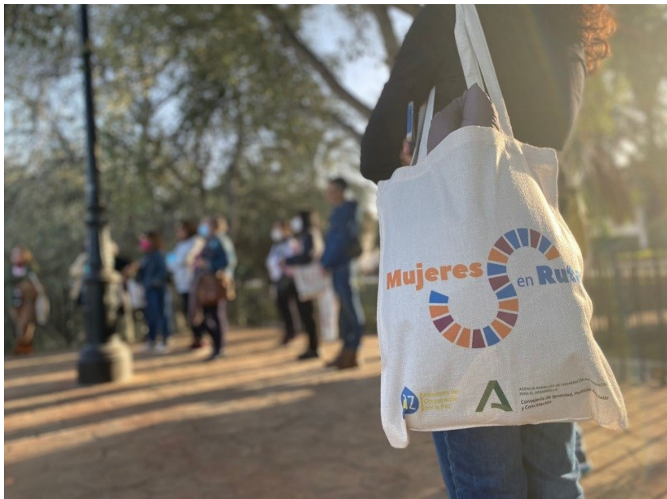
Detalle de una actividad entre IES y AA de Mujeres en Sevilla para visibilizar el rol de la mujer en la historia del barrio

La escuela pública es un espacio central en la construcción de la ciudadanía, y posiblemente sea el aula el espacio en que niños, niñas y jóvenes se reconocen por primera vez como ciudadanos y ciudadanas y donde descubren posibilidades en el ejercicio de sus derechos. Pero la escuela se encuentra claramente vinculada con el espacio público también: el conjunto barrio+escuela se convierte en el contenedor principal de los aprendizajes primarios de la vida política y social de una comunidad. Para ACPP la educación es una clave fundamental para la transformación social ya desde nuestros barrios, que contribuye a la formación de una ciudadanía comprometida en el avance hacia una nueva sociedad civil global a través de la acción local. En los procesos que impulsamos dentro del programa educativo de ACPP Escuelas Sin