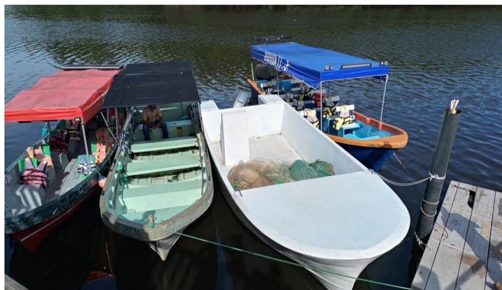
Embarcación La Pluma realizada en la anterior intervención en el sector pesquero y a la que se dará continuidad

En el caso salvadoreño, junto con Fundación para la Cooperación y el desarrollo Comunal de El Salvador (Fundacion Cordes) dando continui-