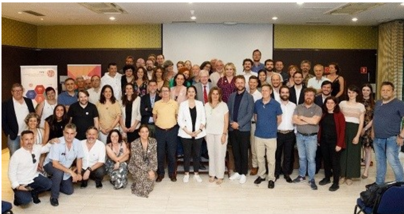
Participantes del evento de Valladolid, en el centro las ministras belga y española y a la derecha la representación de ACPP

El objetivo del evento era contribuir a los debates ministeriales con propuestas consensuadas entre representantes de organizaciones sociales europeas sobre el camino para lograr un futuro habitable y sostenible. Las recomendaciones del encuentro se basaron en las experiencias de trabajo de terreno y las lecciones aprendidas por diferentes organismos de ámbitos diferentes: defensa del medio ambiente, justicia social, sindicalismo, defensa de derechos humanos, entre otros. El propósito fue brindar una perspectiva intersectorial amplia de lo que podría ser una transición ecológicamente efectiva, socialmente justa y equitativa y cuyo coste no recaiga sobre las poblaciones vulnerables en Europa ni la de los países del Sur global. Se profundizó, en particular, en las temáticas vinculadas al bienestar socio-ecológico, al trabajo digno y limpio, al papel de la educación, a la continuidad del Pacto Verde Europeo, a la implicación