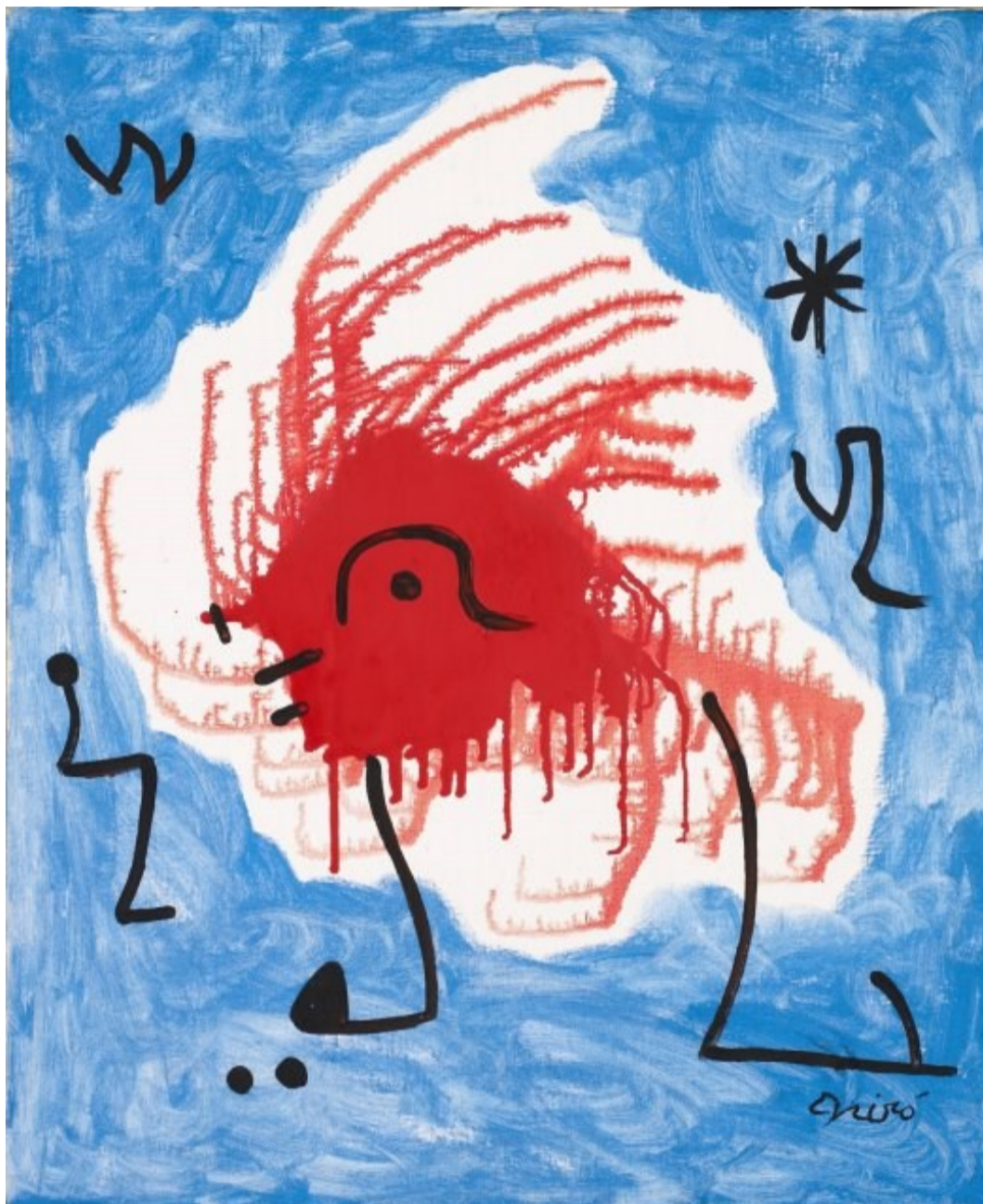
Pájaros rodeando la estrella de la esperanza. Joan Miró 1978

Sin embargo, la desigualdad es una opción política. Fortalecer políticas públicas para facilitar el acceso a derechos económicos, sociales y culturales, civiles y políticos, es otra. Aunque en circunstancias extremadamente difíciles a causa de una tendencia ideológica global que no ayuda, existen ejemplos de este otro enfoque que nos impulsan a mantener la esperanza en la transformación y el progreso social: los nuevos gobiernos en Colombia, Honduras o Brasil, o más cerca, el Gobierno de coalición progresista