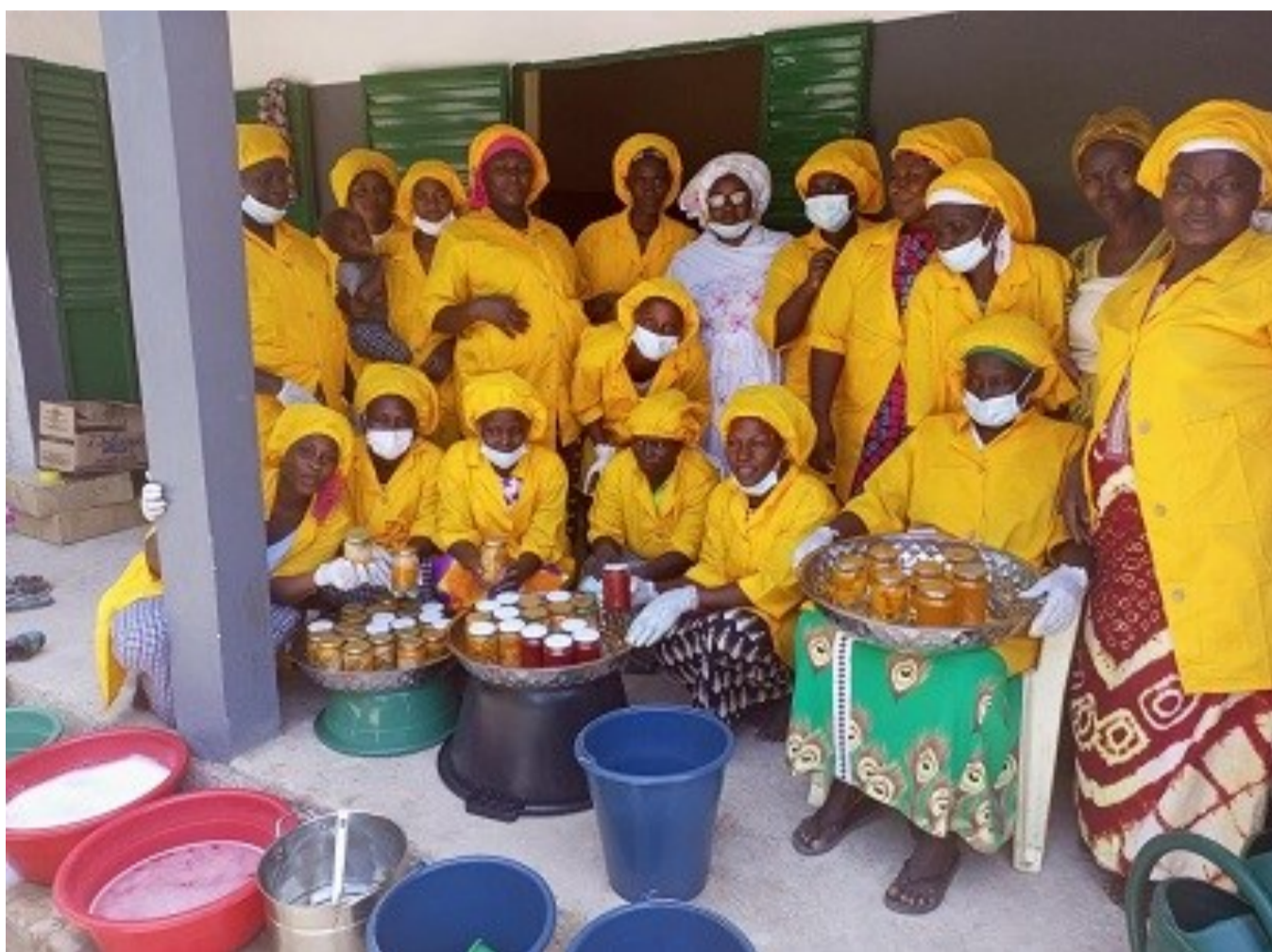
Taller de conservación de alimentos impartido en Dar Salam Bantan Cuntu

En la región de Ziguinchor, donde la agricultura emplea a más de tres cuartas partes de la población activa, ACPP y nuestra socia local USOFORAL (Comité Regional de solidaridad de mujeres por la paz en Casamance) estamos impulsando estas prácticas en huertas comunitarias gestionadas por agrupaciones de mujeres para mejorar la seguridad alimentaria. Concretamente, con el apoyo del Gobierno Balear, las mujeres campesinas de Dar Salam Douma y Dar Salam Bantan Cuntu (comuna de Nyassia) han incorporado técnicas respetuosas con el medio ambiente y están produciendo diferentes variedades de vegetales, hortalizas y frutas para mejorar la alimentación de sus familias y comunidades. Las actividades realizadas para la rehabilitación de las