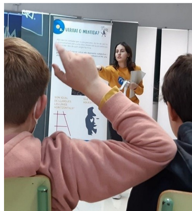
Dinamización del recurso "Mira Tú" en el IES Berenguer d'Anoia – 1º ESO

En Baleares, desde la Dirección General de Cooperación, se está promoviendo la institucionalización de las propuestas de Educación para la Transformación Social favoreciendo sinergias entre los centros educativos y los agentes de cooperación, como las ONGD. Desde hace cinco años, la Dirección de Cooperación tiene un convenio con la Dirección de Innovación Educativa de la Conserjería de Educación para impulsar el programa de Centros Educativos para la Ciudadanía Global y Transformadora . A los centros que se adhieren al programa se les facilita formación para el profesorado e información de las diferentes propuestas educativas de las ONGD para que puedan incorporarlas a su planifica-