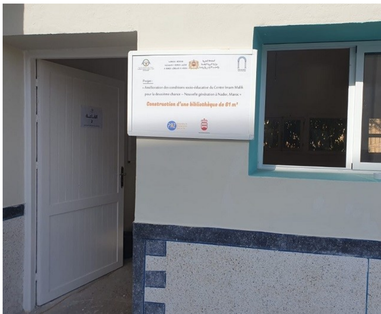
Entrada a la biblioteca construida en el Centro Al Imam Malik de Nador con el apoyo del Ayuntamiento de Alcorcón

Desde que comenzamos nuestro trabajo en Marruecos, hace ya 23 años, la educación ha sido un eje transversal en nuestra estrategia de intervención que hemos desarrollado tanto en la región de Tánger-Tetuán-Alhucemas como en la región de la Oriental, y siempre de la mano de las organizaciones socias de la sociedad civil marroquí. A lo largo de estos años, hemos ido adaptando nuestros proyectos a los retos planteados desde el sistema educativo marroquí, mejorando la calidad educativa en el ciclo de primaria, acompañando el proceso de instauración del preescolar e incorporando la educación en valores y la coeducación como un eje transversal en todas nuestras intervenciones. Para ACPP, la escuela es un espacio esencial para la construcción de ciudadanía, y por ello, un pilar en la lucha para la reducción de las desigualdades sociales.