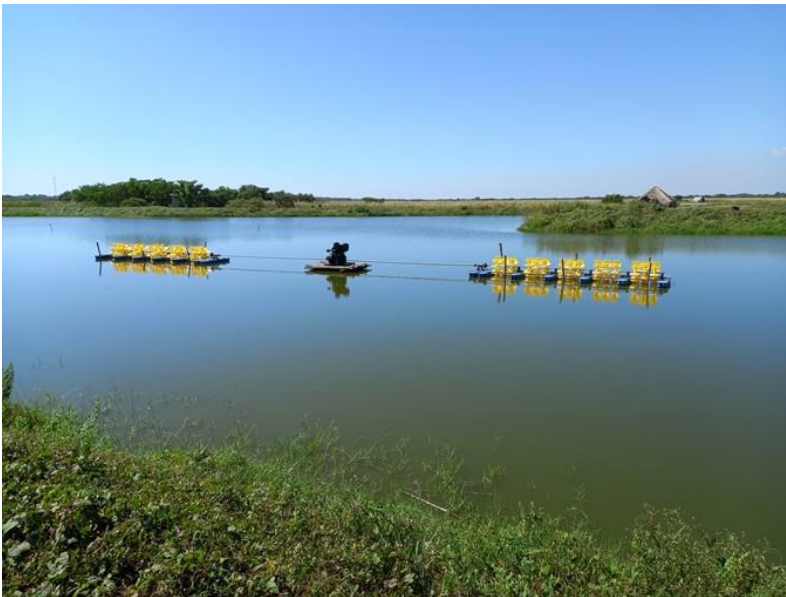
Aireadores adquiridos con fondos propios Cooperativa Chinandega (16/12/2022)