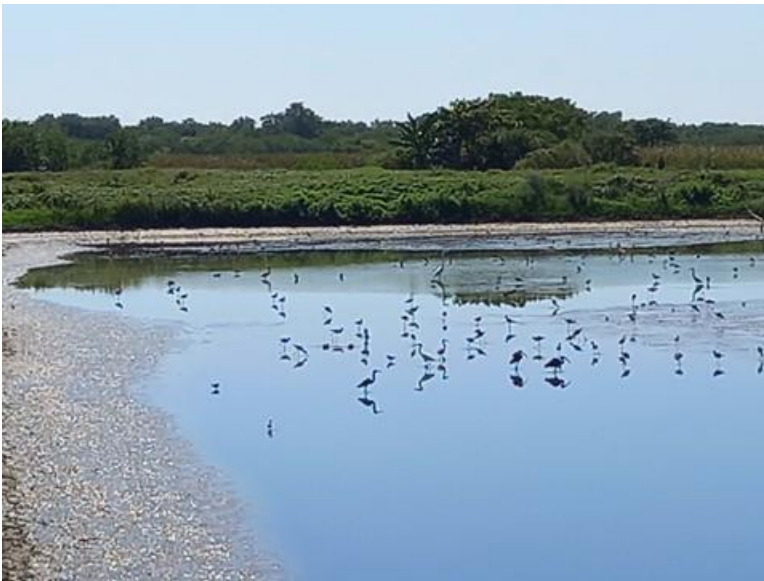
Estanque vacío (fin de ciclo) Cooperativa El Aguilucho (16/12/2022)