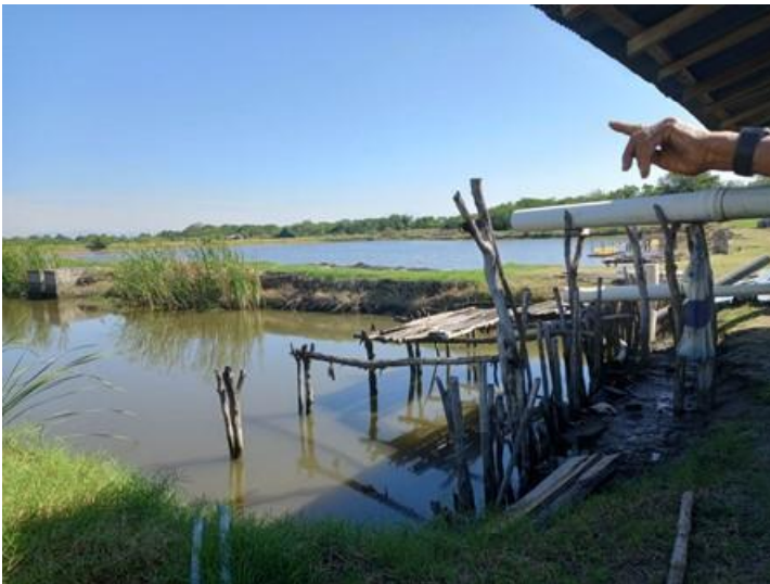
Captación de agua y estanque Cooperativa Los Piñalitos (16/12/2022)