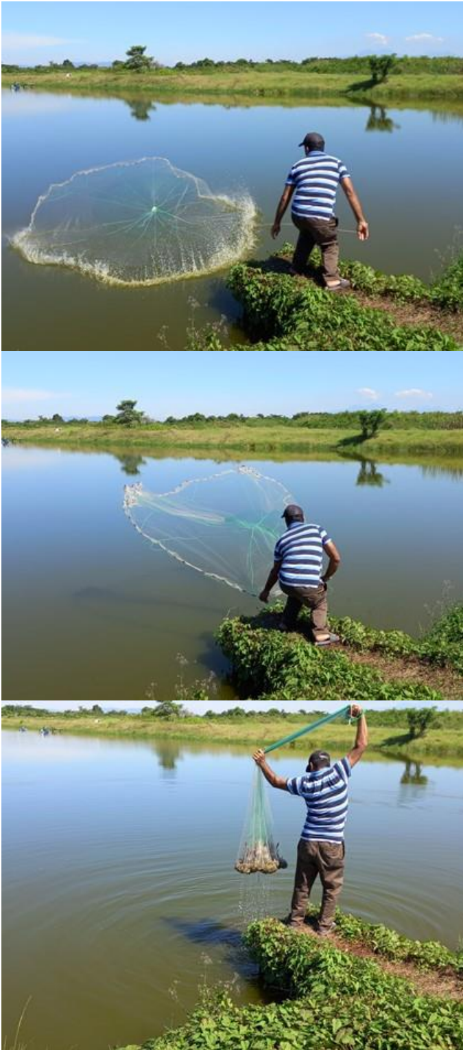
Secuencia de cosecha de camarón Cooperativa Chinandega (16/12/2022)

“ Mejorar las capacidades técnicas, materiales y el posicionamiento social del sector pes-quero artesanal, y su cadena de valor, desde un enfoque sostenible e inclusivo”