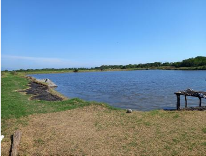
Estanque Cooperativa Los Piñalitos (16/12/2022)