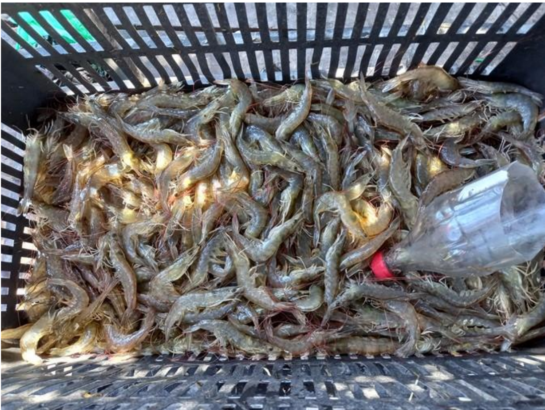
Camarones de calibre 10 aproximadamente (16/12/2022)