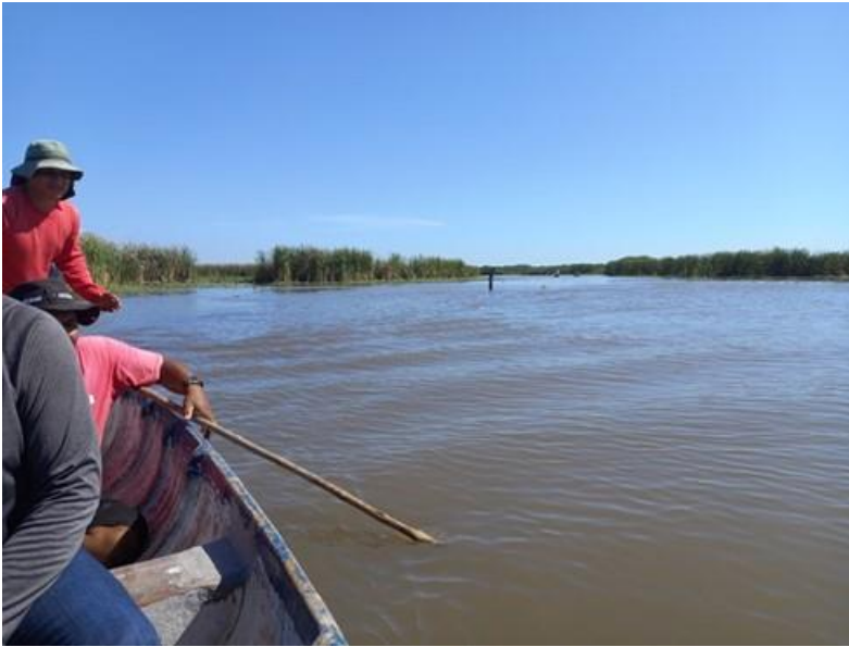
Trayecto por manglar para llegar a los estanques desde la Comunidad Las Zorras (16/12/2022)