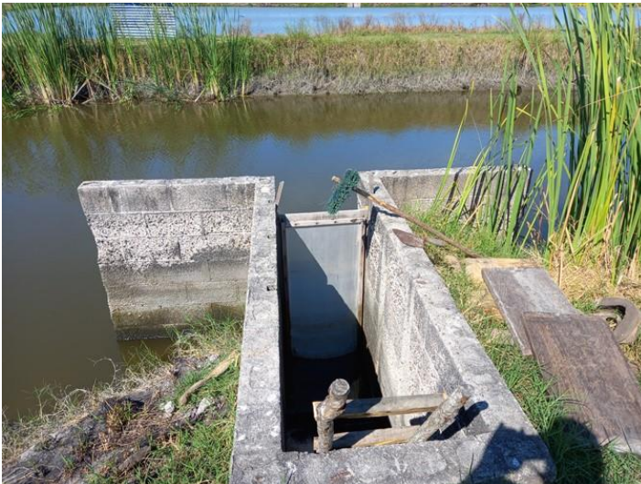
Exclusa captación de agua Cooperativa Chinandega (16/12/2022)