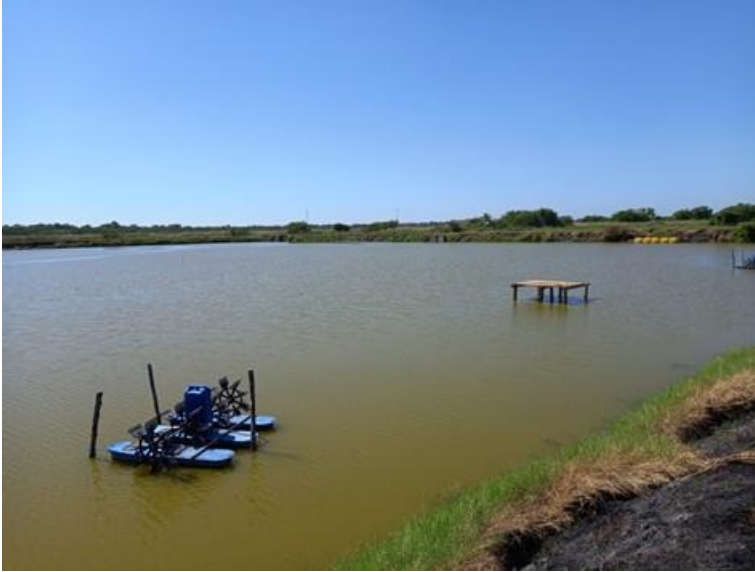
Estanque con aireadores Cooperativa Los Piñalitos (16/12/2022) Aireadores grises adquiridos con fondos de la Xunta de Galicia y aireadores amarillos (al fondo) adquiridos con fondos propios de reinversión de ingresos.