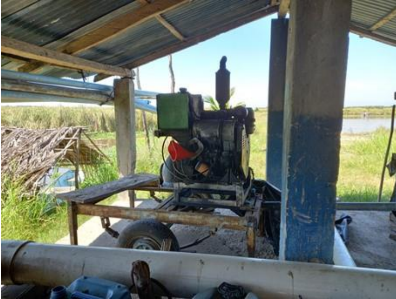
Bomba extracción agua Cooperativa El Aguilucho (16/12/2022)