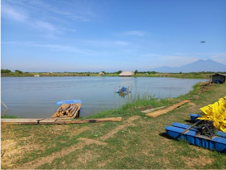
Estanque Cooperativa Chinandega (16/12/2022) Aireadores grises adquiridos con fondos de la Xunta de Galicia y aireadores amarillos (al fondo) adquiridos con fondos propios de reinversión de ingresos.