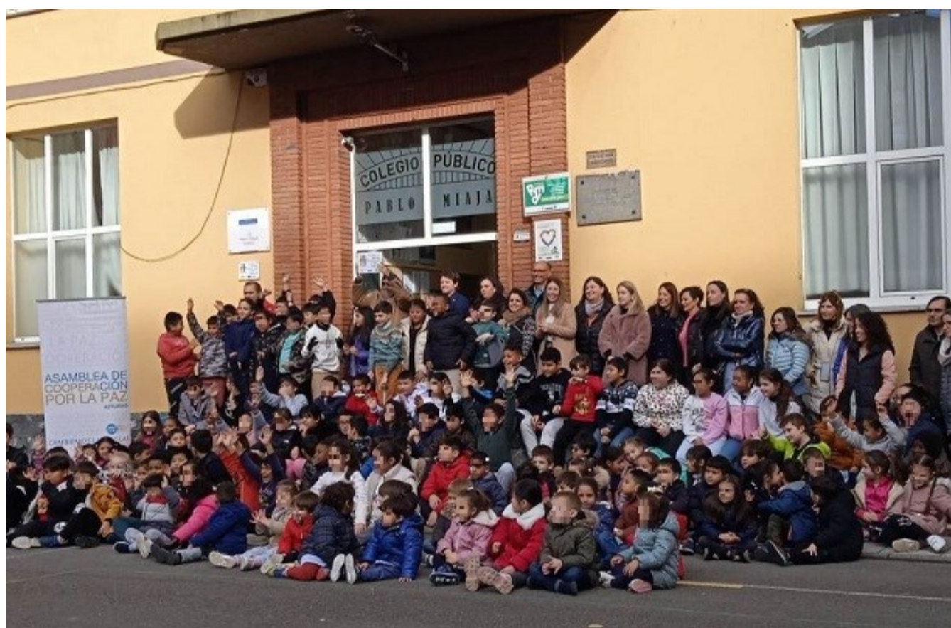
Foto de familia durante el acto final del proyecto en el CEIP Pablo Miaja.

El alumnado de 1º hasta 3º de Primaria, trabajaron con el Cuento con las Amapolas , donde se narra la historia de José, que sufre una situación de discriminación y acoso por parte de sus compañeros y compañeras de clase, que les ofrece