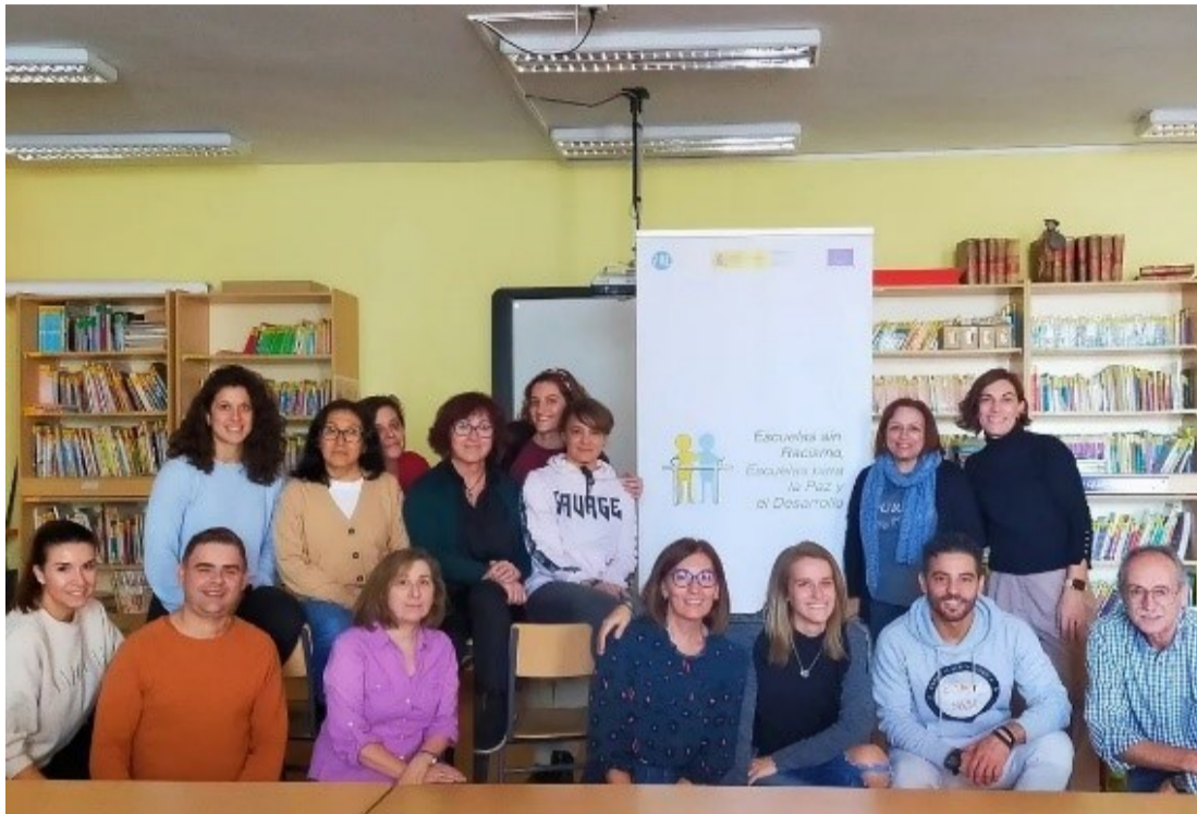
Profesorado del CEIP El Espinillo en Villaverde (Madrid)

Además, hemos mejorado los valores de cultura de paz y no violencia, la solidaridad internacional, los Derechos Humanos, la equidad de género, el respeto a la diversidad y la sostenibilidad medioambiental de la comunidad de Villaverde y Orcasitas en Madrid, y de A Coruña y Ourense en Galicia. Hemos contribuido al pensamiento crítico, a la empatía, a la tolerancia, a la diversidad y a la reflexión de toda la población benefi-