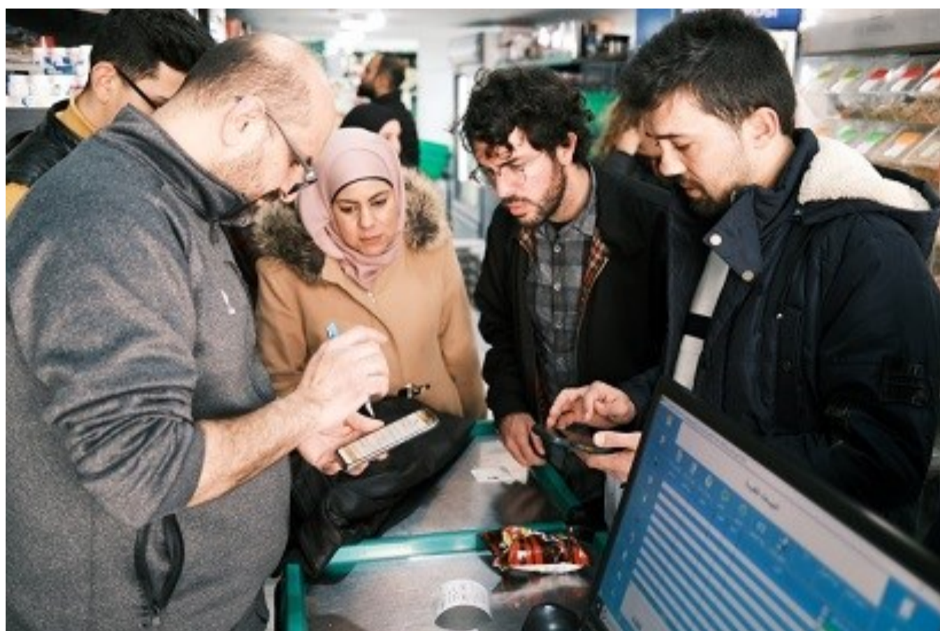
Utilización de una moneda local en Palestina

A falta de iniciar un proceso de deliberación interna que nos permita fijar posiciones sobre conceptos relevantes, tanto por su centralidad en relación al objeto de este proceso (cooperativas, economía social, empresas so-