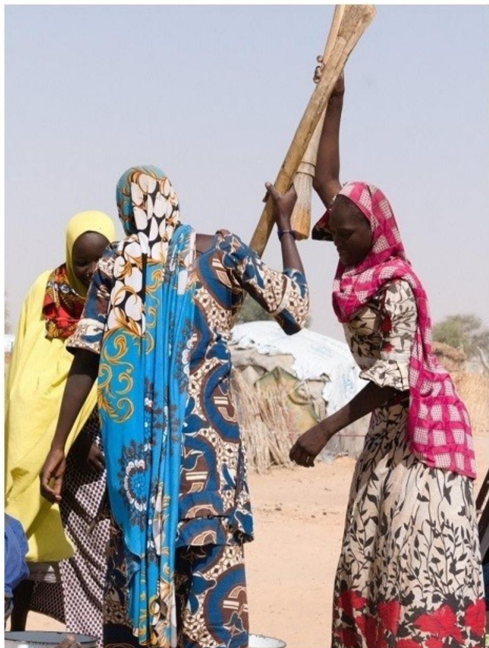
Fotografía (detalle) de ONG DIKO, Níger 2022