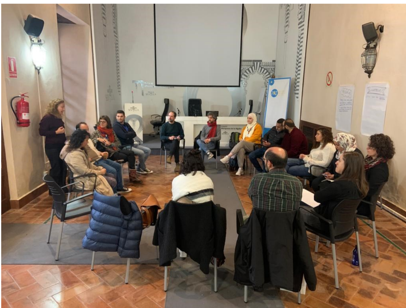
Una de las sesiones de trabajo de encuentro MedTOWN de Sevilla.

Han participado representantes institucionales de Jordania, Grecia, Palestina, Marruecos y España, de gobiernos locales, como Sevilla o Beitillu, y de organizaciones e instituciones internacionales, destacando entre ellas al Parlamento Europeo, la Dirección General de la Comisión Europea de Política Europea de Vecindad y Negociaciones de Ampliación, Grupo de Tra-