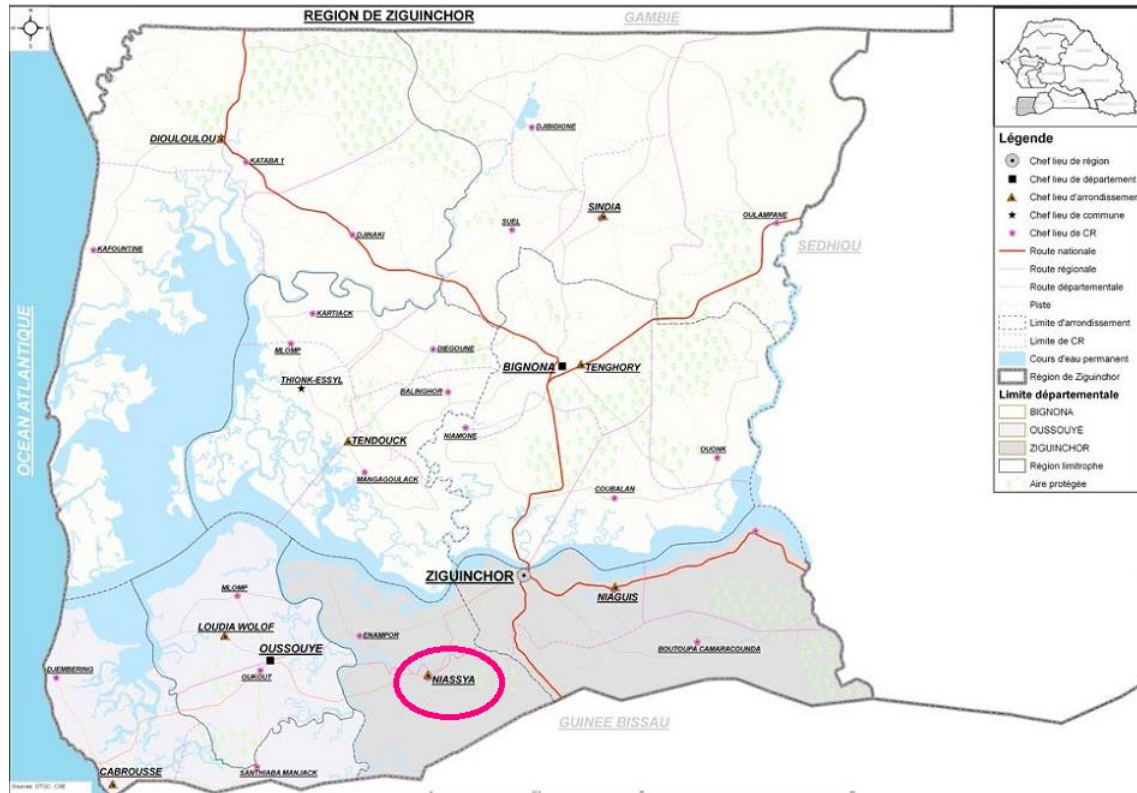
Imagen 1. Mapa de la Región de Ziguinchor.

Municipio de Nyassia, que cuenta con una población estimada de 10.677 habitantes (5.223 mujeres y 5.454 hombres) 4 .