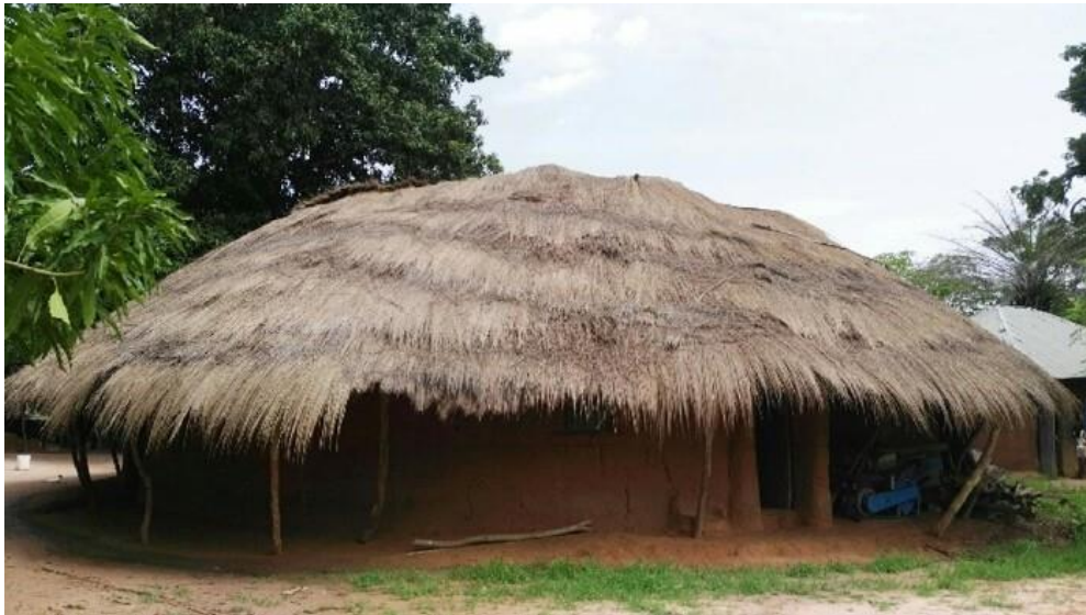
Imagen 3. Vivienda en el Municipio de Nyassia con techos de paja.

manuales 5 . Durante la evaluación no se han podido encontrar estadísticas sobre la tasa real de acceso al agua potable y el saneamiento de la población de la región y del Municipio. A nivel de las viviendas, se trata de construcciones de barro con techos de paja. Cuando han podido ser renovadas, los techos son de zinc o uralita.