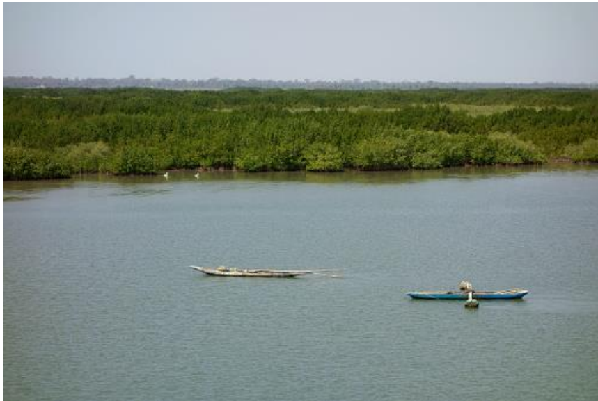
Imagen 2. Foto del río Casamance.

La región está influenciada por el clima sub-guineano, que favorece la pluviosidad en comparación con las regiones del centro y del norte. La vegetación es frondosa, con un dominio forestal formado por bosques secos densos y bosques de galería localizados principalmente en la parte sur. El manglar y el palmeral colonizan la zona fluvial-marítima, y también hay bosques de aserrín. La región tiene un importante potencial de vida silvestre. Las galerías forestales y algunos bosques protegidos contienen una variedad de especies animales monos, puercoespines y reptiles 6 .