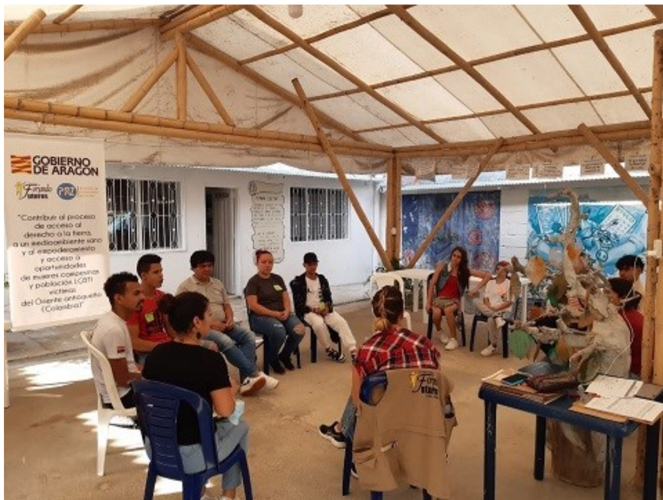
Encuentros colectivos LGTBI+. San Carlos. Abril 2022

Durante el auge de la violencia, entre los años