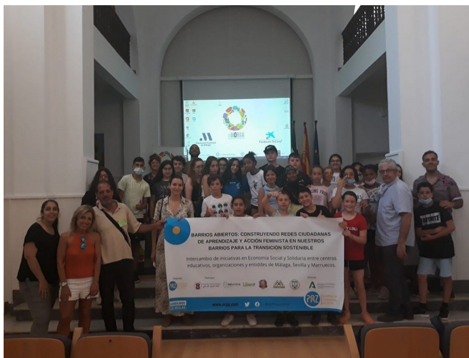
Foto de familia de los aptricipantes en el Encuentro al final de este.

Este intercambio de experiencias ha surgido de los grupos motores desarrollados en los centros educativos y que han trabajado durante meses en el proceso de creación de huertos escolares. Esta actividad se ha estado realizando con IES y CEIP de las provincias de Málaga y Sevilla, por medio de diferentes dinamizaciones entorno a la ESS, como alternativa al consumismo y la introducción a la permacultura, como sistema agrícola diseñado para el mantenimiento consciente de sistemas productivos agrarios que imitan la diversidad, la estabilidad y la resiliencia de los ecosistemas naturales. En el encuentro, el alumnado participante de las dos provincias lle-