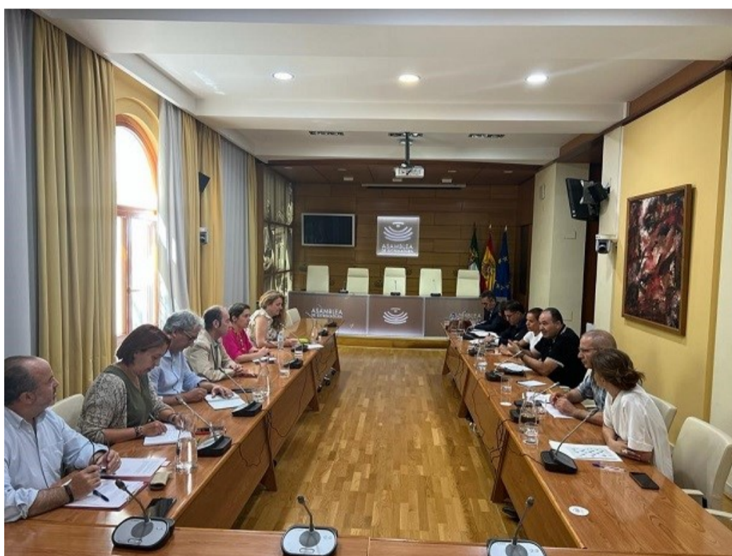
Encuentro en la Asamblea de Extremadura con portavoces de la Comisión de Igualdad y Cooperación al Desarrollo.

Durante estos tres días hemos mantenido distintos encuentros y reuniones con diferentes colectivos de la sociedad civil extremeña que trabajan por los derechos de la población migrante, tanto en Extremadura como en Marruecos. Con la Directora General de Políticas Sociales e Infancia de la Junta de Extremadura nos reunimos para conocer la situación en Extrema-