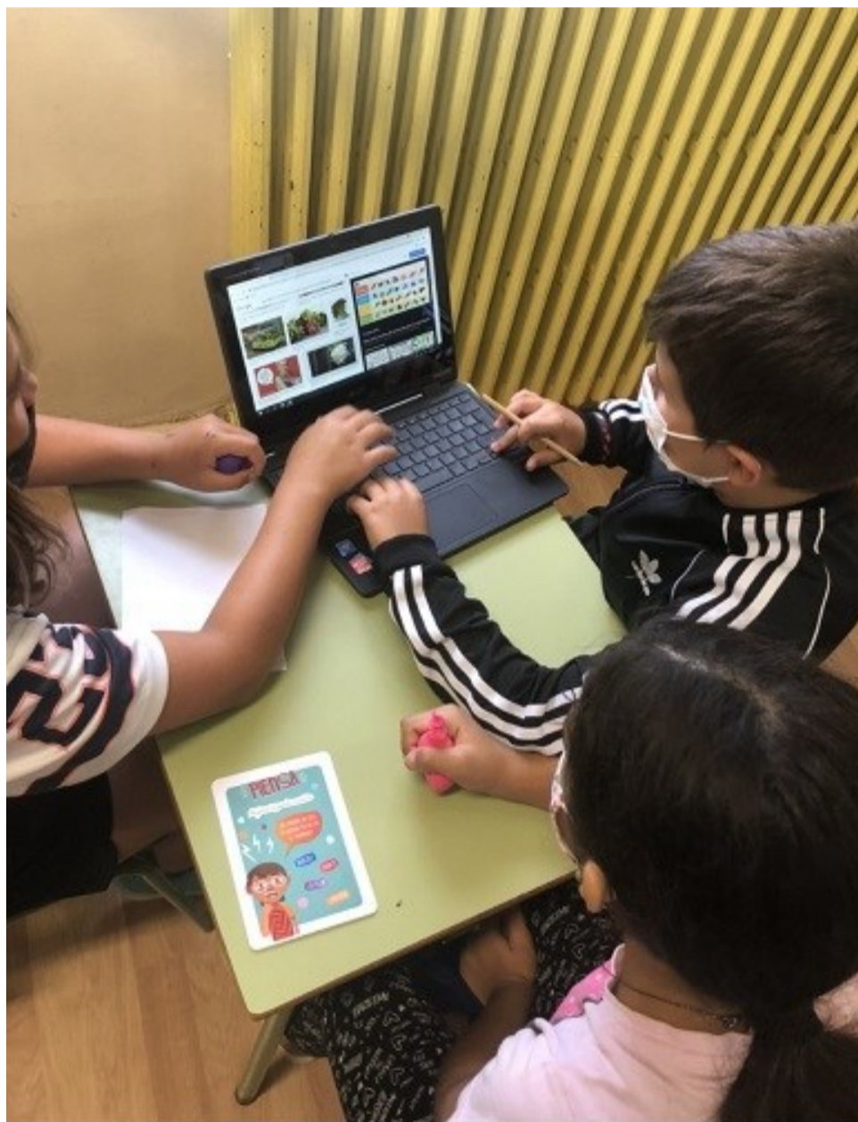
Alumnado utilizando el juego online.

Durante estos cuatro años, el apoyo de la Diputación Provincial de Zaragoza al programa ha posibilitado la participación de alumnado, profesorado y familias de catorce centros educativos de la provincia de Zaragoza en los que las actividades propuestas han favorecido la reflexión crítica con las desigualdades sociales y el cambio climático, así como el reconocimiento y el ejercicio de la capacidad que tenemos para transfor-