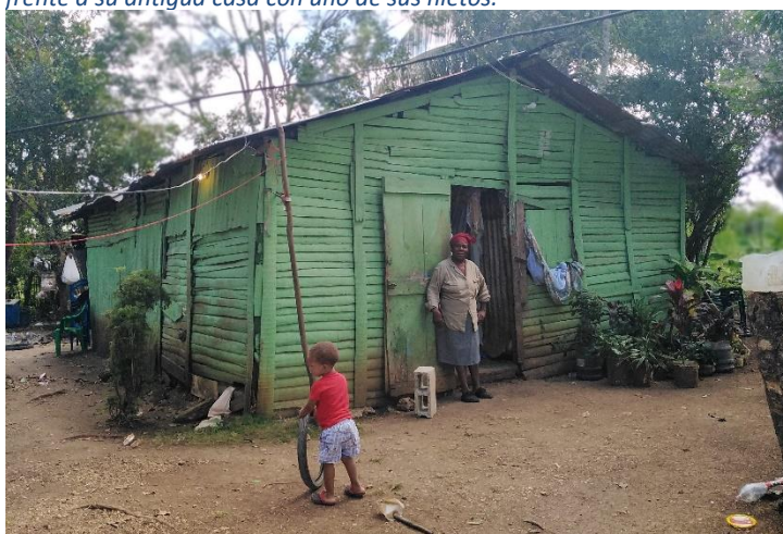
Imagen 2: Mujer de origen haitiano beneficiaria de una nueva vivienda, frente a su antigua casa con uno de sus nietos.

El proceso de identificación de beneficiarios y beneficiarias de las viviendas fue liderado por la propia comunidad con la Junta de Vecinos como estructura comunitaria de referencia y donde, bajo criterios de vulnerabilidad, se identificaron aquellas unidades familiares con más necesidades. Este componente coloca además a la mujer como protagonista, otorgándole así casi la total titularidad de las viviendas (de las 8 viviendas, 6 fueron entregadas a mujeres jefas de hogar).