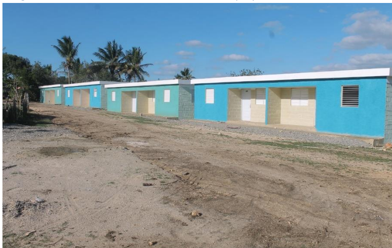
Imagen 3 Viviendas construidas con recursos del proyecto