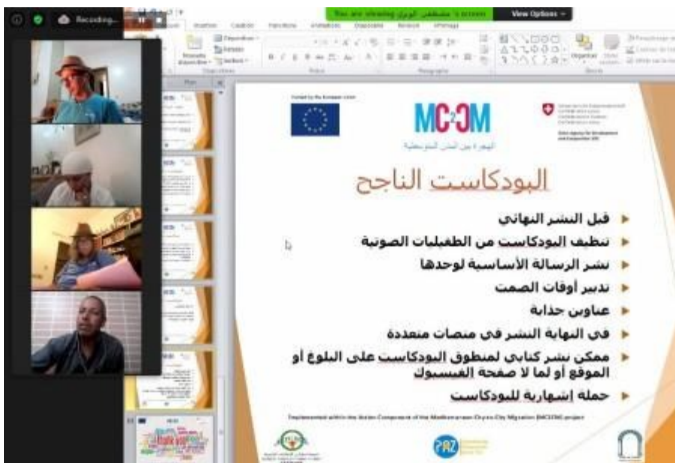
Pantallazo formación online vía zoom sobre sobre prensa objetiva y ética periodística celebrado en julio y agosto en Nador.

ACPP en Marruecos lleva trabajando por el Derecho a la Movilidad desde el año 2005 con organizaciones socias como AHLAM o la UAF en Tánger y ASTICUDE y HETE en la Oriental. En este trabajo, la sensibilización y construcción de un nuevo discurso sobre las migraciones se ha convertido en uno de los ejes que acompañan todas nuestras acciones. A lo largo de todo el período de emergencia debido a la COVID-19, hemos visto cómo las personas migrantes han desaparecido de los medios de comunicación