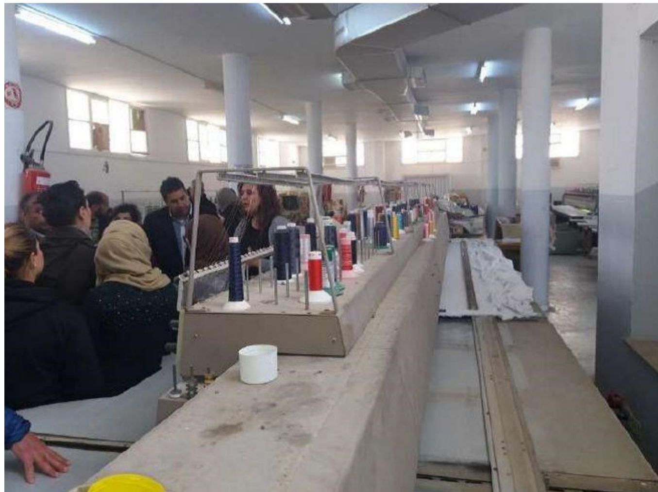
Una de las visitas realizadas a la fábrica SOBREF, junto con las obreras.

En el año 2016, las mujeres y hombres que trabajaban en la fábrica SOBREF, situada en la ciudad de Mahdia vieron como después de haber dedicado la mayor parte de su vida a trabajar en la misma se quedaron en la calle, con una indemnización irrisoria.