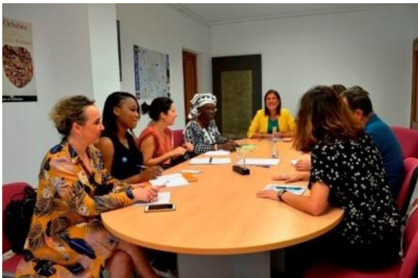
Encuentro entre las representantes de COSEF y ACPP con el Instituto de la Mujer de Extremadura.

En materia de participación política, tres de nuestras socias (USOFORAL, COSEF y USE) se han entrevistado en distintas ocasiones con instituciones públicas para intercambiar impresiones sobre el proceso de adopción de la paridad y la integración del enfoque de género en las instituciones en ambos países; hablamos entre otras con la Comisión de Igualdad de la Asamblea de Extremadura, los institutos de la mujer de Asturias y de Extremadura, la Diputación foral de Bizkaia, la Agencia Asturiana de Cooperación, el Ayuntamiento de Palma de Mallorca o el Ayuntamiento de Avilés. Estos encuentros permiten, por una parte, que las instituciones comprendan mejor el trabajo que realizamos en el