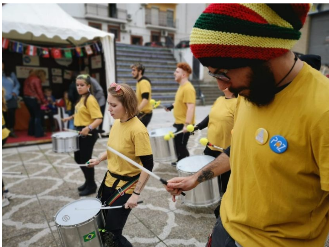
Detalle de la Batucada de San Juan de Aznalfarache participando en la IV Feria de las Culturas. Diciembre 2019. Un proyecto de ACPD con el apoyo de la AACID.

La batucada es expresión, es cultura, pasión, fuerza... pero también, para este Foro, es coherencia, responsabilidad, solidaridad y es, y será, altavoz de su esperanza en la lucha por su comunidad. ●