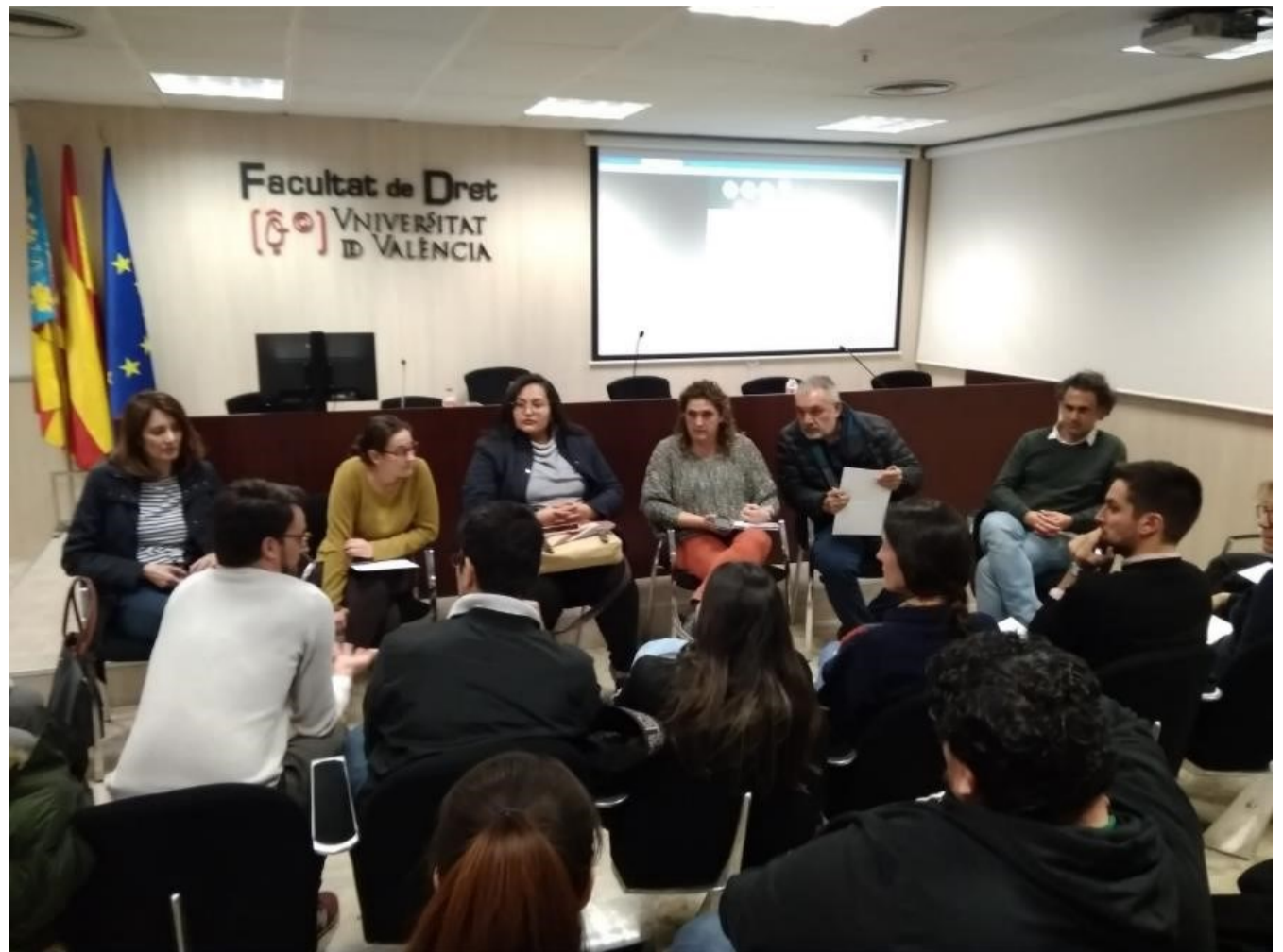
Sesión de estudio en la Universidad de Valencia con especialistas del Instituto de Derechos Humanos de la UV.

Tuvimos la oportunidad de reunirnos con la Conselleria de Participación, Transparencia, Cooperació y Calidad Democrática, institución que apoyó el proyecto en el que se enmarca esta visita, y la Conselleria de Justicia, Administración Pública, Reformas Democráticas y Libertades Públicas de la Comunidad Valenciana, espacios institucionales donde pudimos denunciar la situación de los/as reclamantes de tierras, así como de los líderes y lideresas defensores de Derechos Humanos de Colombia.