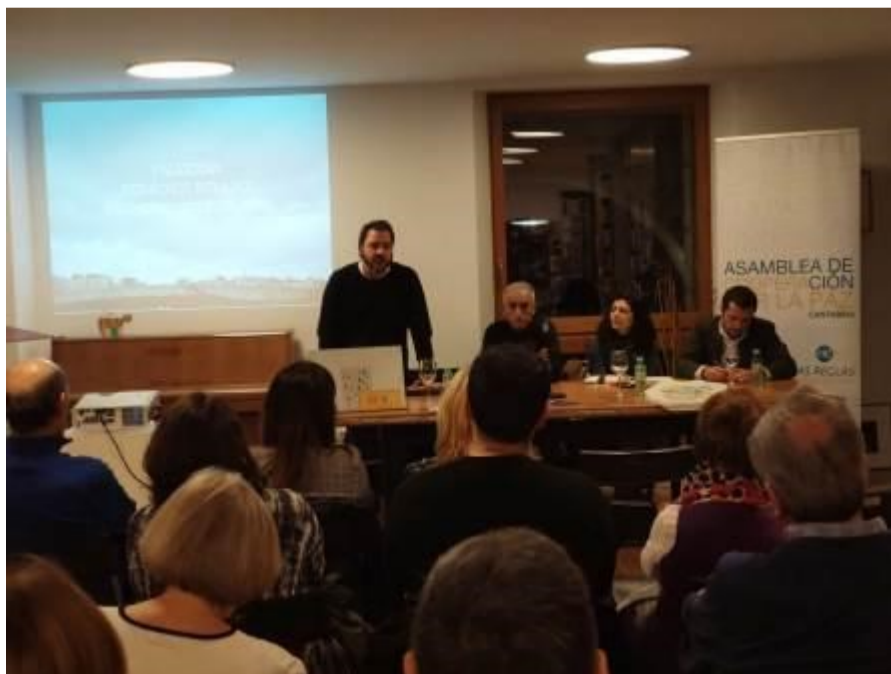
Charla-coloquio en la librería Gil de Santander.

La actividad principal fue una charla-coloquio en la Librería Gil de Santander, un espacio de encuentro en el que duran-