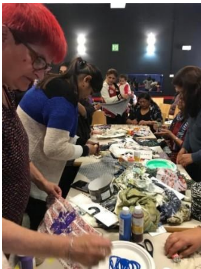
El encuentro de grupos de mujeres costureras

ACPP, además, se ha convertido en un referente en cuanto a diseño y gestión de monedas complementarias. En Catalunya, en concreto, junto a las empresas Learning By Doing y Clickoin, gestionamos la moneda local de la ciudad de Santa Coloma de Gramenet, La Grama . Dicha moneda, que para ser precisas, es un modo de pago a través de una aplicación de móvil, lleva circulando desde hace tres años. El objetivo de su creación fue asegurar que las subvenciones