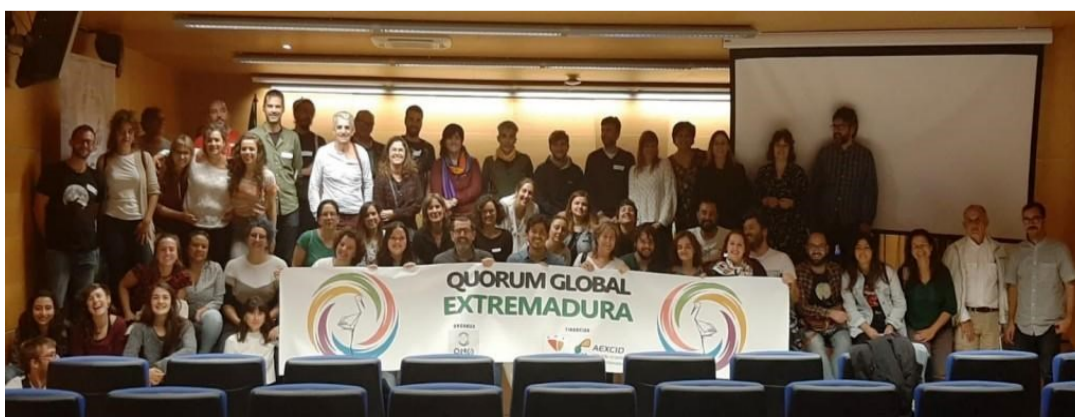
Asistentes al Quórum Global de Extremadura

pacio que busca transformar y elevar el activismo a política transformadora, un espacio donde se amplíe la mirada, el foco y que permita establecer sinergias entre distintos movimientos e iniciativas. Un espacio donde hemos debatido y reflexionado en torno a tres ejes temáticos, ejes que están guiando la política de cooperación extremeña en los últimos años y donde ACPP Extremadura está enmarcando su estrategia de in-