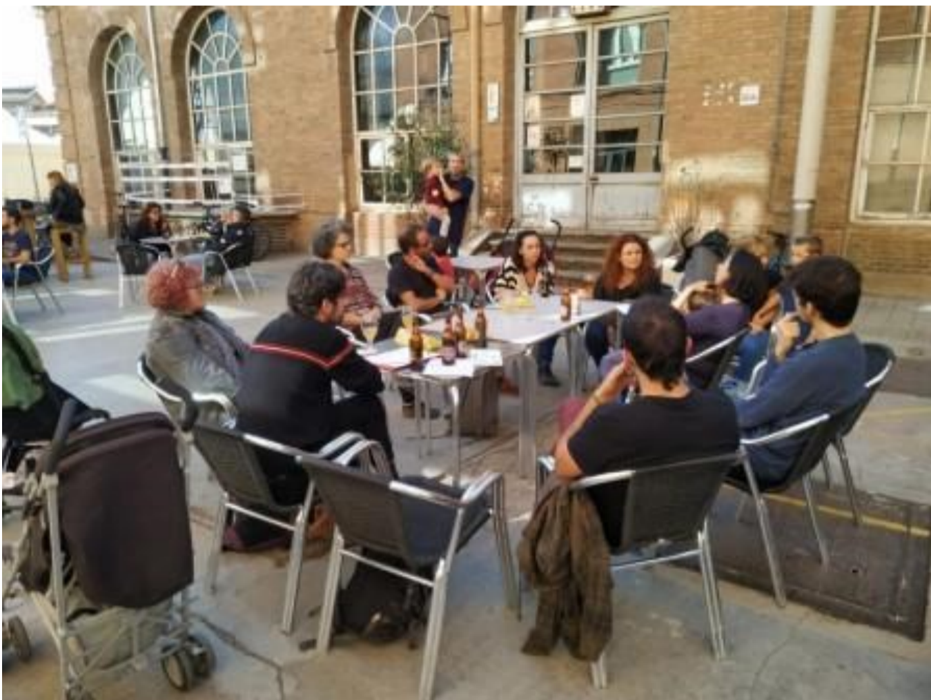
“Vermú” con la base social en la FESC 2019 (Feria de la Economía Social de Catalunya): debate sobre la situación sociopolítica catalana y las elecciones de noviembre de 2019

Una primera línea de trabajo a señalar es la Economía Social y Solidaria (ESS). Catalunya ha sido tradicionalmente un importante foco de nacimiento de organizaciones en el marco de la