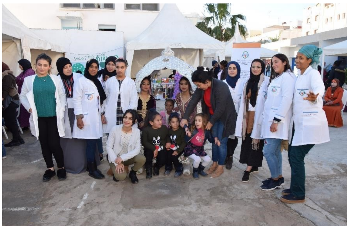
Souk Afrika 2018, celebrado, entre otros, con el apoyo de AEXCID'17

A pesar de los avances realizados en el marco jurídico, aún queda un largo camino por reco-