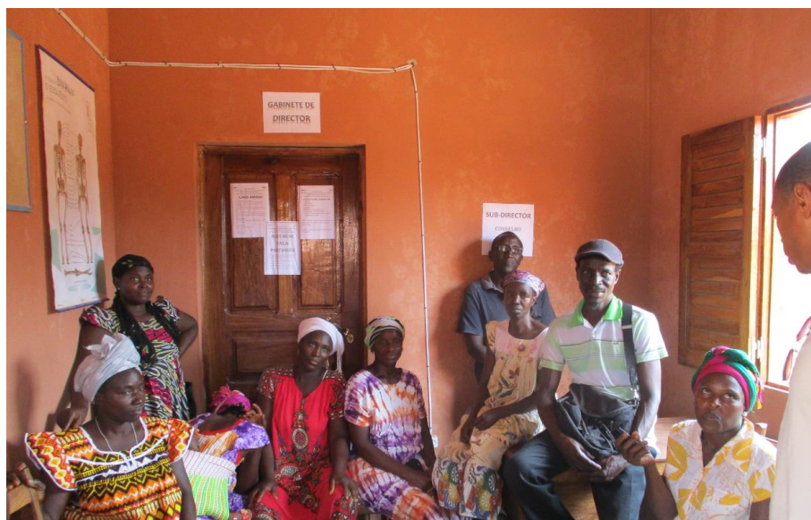
Encuentro con Asociación de Mujeres Camassompa