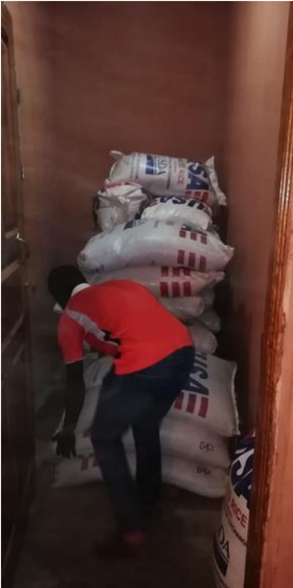
Alimentos del PAM en el almacén de la escuela