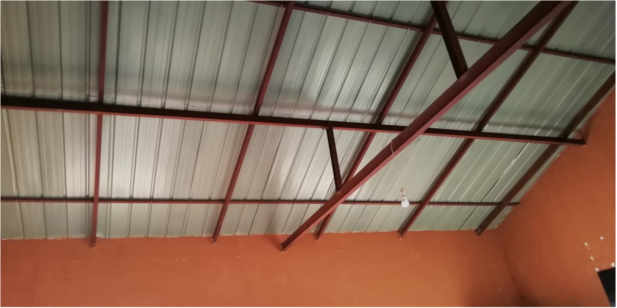
Detalle de la cobertura instalada en el bloque nuevo de la escuela