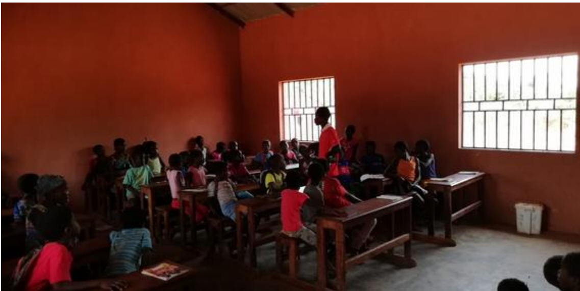
Pupitres de la escuela y detalle de las ventanas (arriba). Resto de equipamiento del aula (abajo)