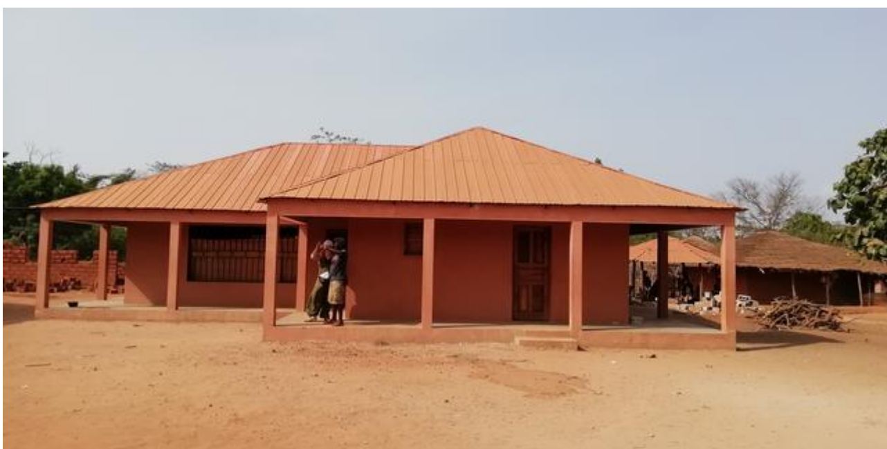
El bloque para el comedor y almacén de la escuela

Detalle de la escuela, tanto del bloque rehabilitado con tres aulas como del nuevo bloque con 4 aulas y gabinete de dirección y de profesorado.