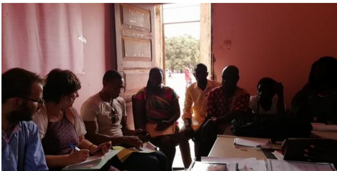
Entrevista con el equipo de la DRE en Tombali y los y las inspectoras de educación formados.