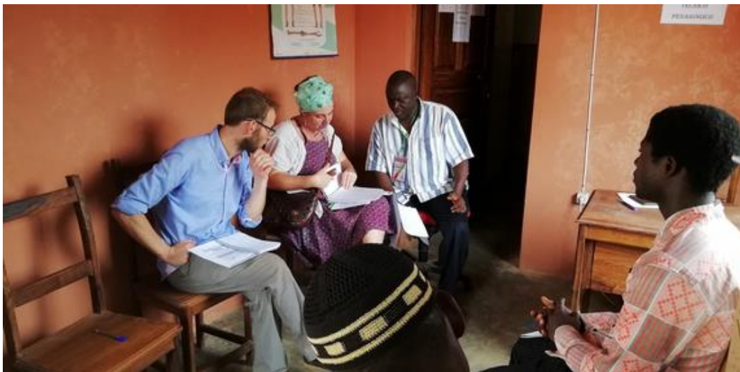
Parte del equipo entrevista evaluadora con el director de la escuela y revisión de los datos de matriculación