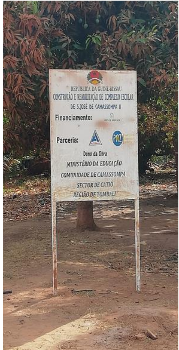
Cartel de visibilidad del proyecto en la comunidad