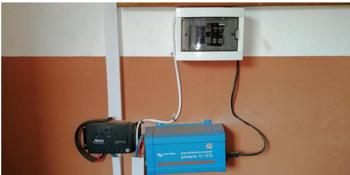
Parte del sistema fotovoltaico en perfecto funcionamiento