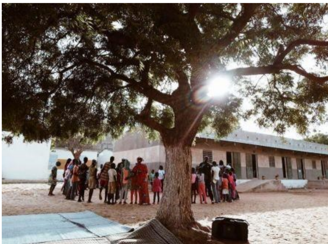
Campaña de Promoción del Derecho Humano a la Alimentación en el Distrito de Cas-Cas

Y con el apoyo de la Junta de Castilla y León, a través del programa Promoción del derecho humano a la alimentación en el Distrito de Cas-Cas , en ACPP Castilla y León estamos consiguiendo desarrollar proyectos que, sin duda, sirven como impulso a la hora de construir un nuevo y prometedor futuro en Senegal. ¿Cuáles son nuestros campos de actuación?: