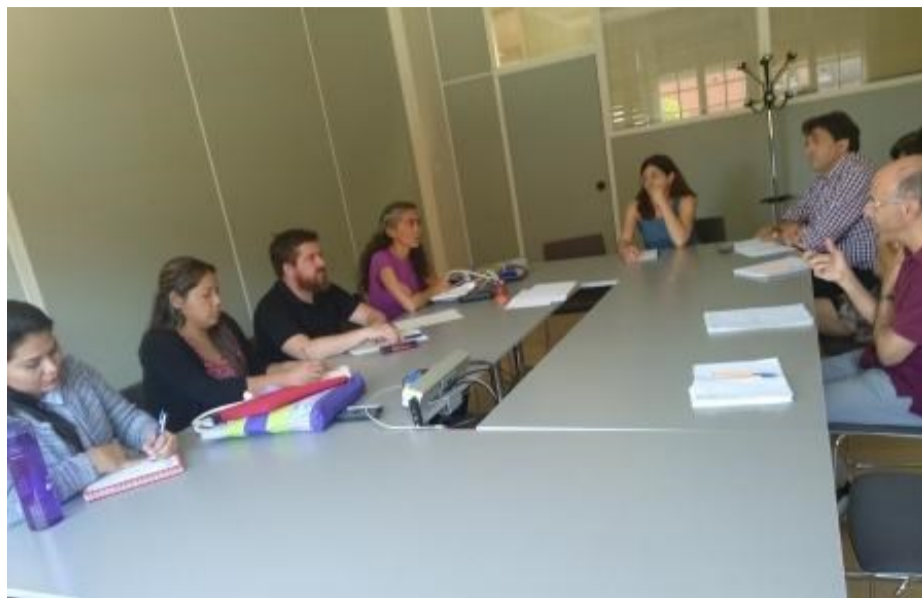
Reunión con el Gobierno de Navarra

ORMUSA y ACPP llevan trabajando desde el año 2006 en El Salvador en una estrategia de tres ejes fundamentales: desarrollo, apoyo y evaluación de las políticas públicas para la promoción de la igualdad y la lucha contra la violencia hacia las mujeres, tanto a nivel local como nacional; fortalecimiento de la sociedad civil feminista, desde lo comunitario a las plataformas regiona-