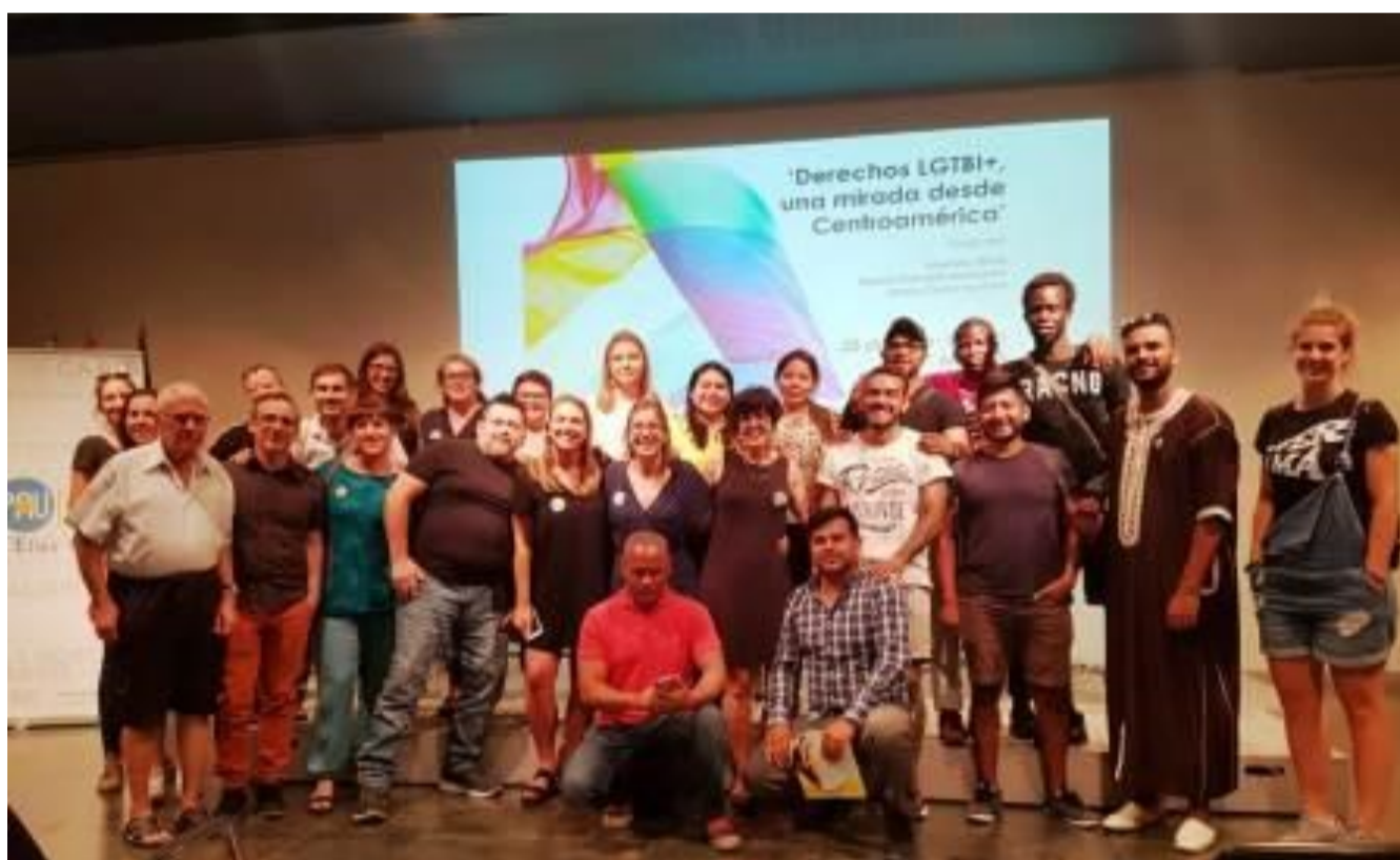
Foto de cierre del acto "Derechos LGTBI+. Una mirada desde Centroamérica"

Las compañeras salvadoreñas profundizaron en esta mesa redonda en la realidad de la pobla-