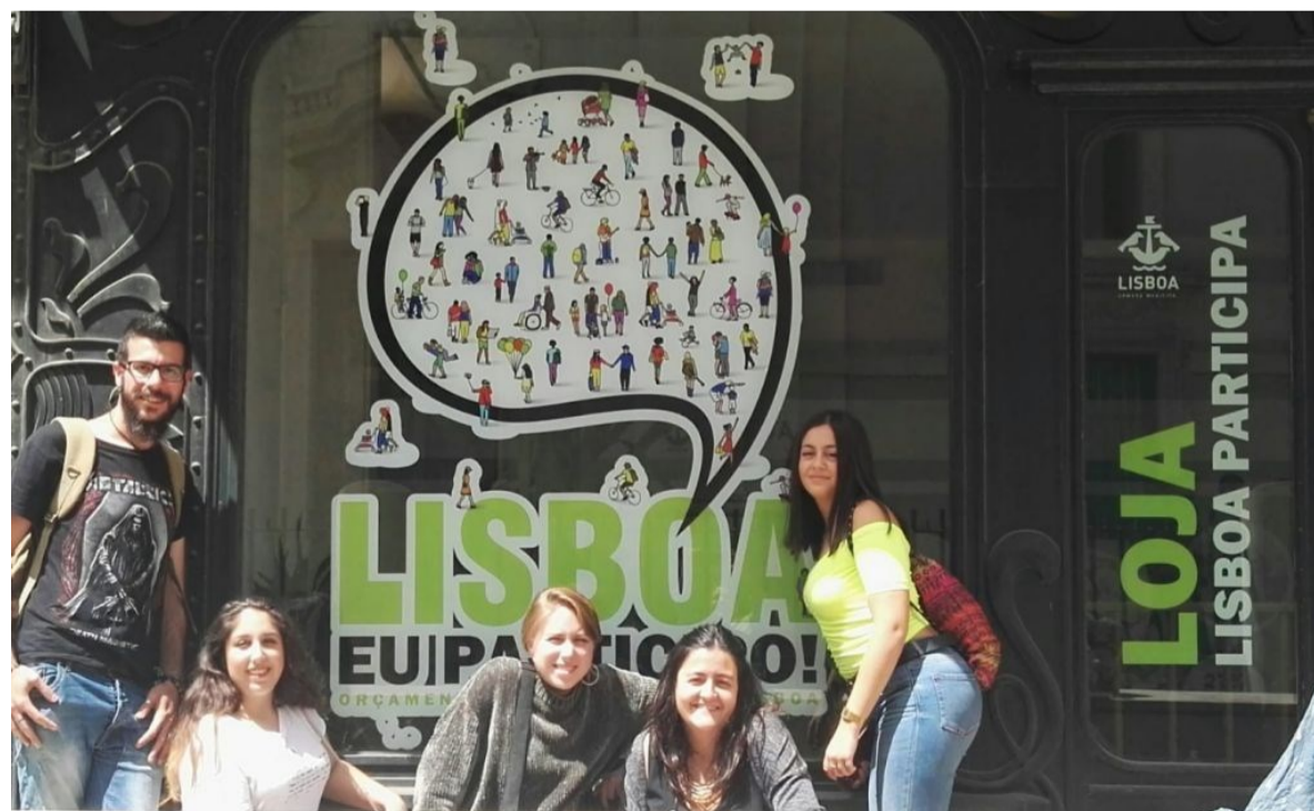
Integrantes del Foro Joven de San Juan de Aznalfarache en su visita a Lisboa

Así, entre los días 6 y 9 de junio, con el apoyo de ACPP, la Junta de Andalucía y el Ayuntamiento de San Juan de Az-