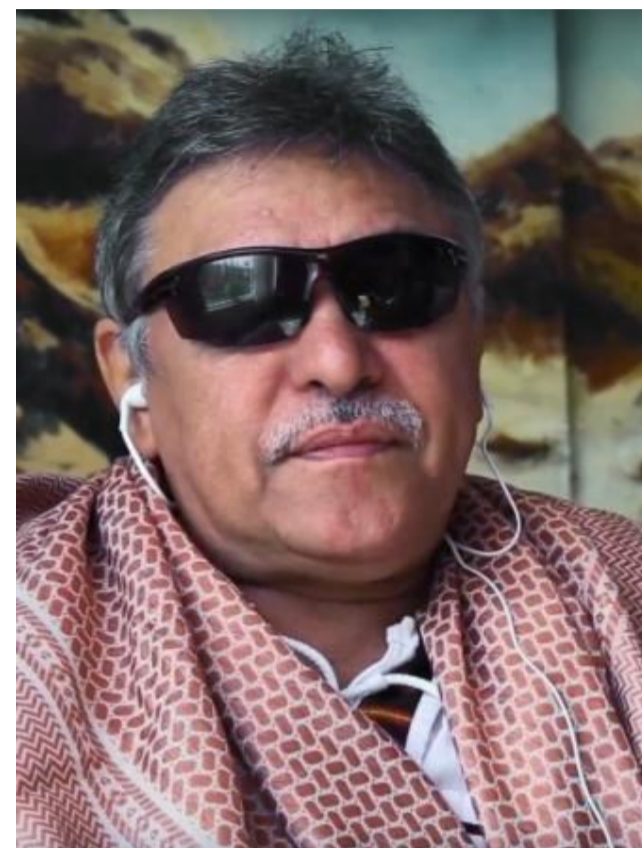
Jesús Santrich en una imagen de 2017

Pero no todo el balance es negativo. Las FARC-EP, como partido político, han demostrado