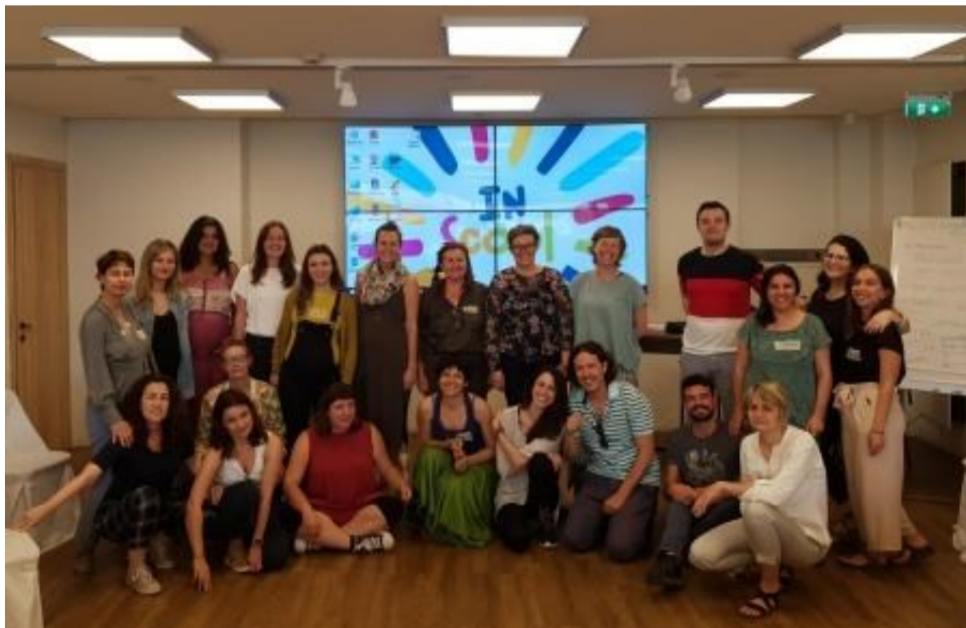
Foto de familia de los y las participantes en el encuentro de Atenas

Como dice el “Índice para la Inclusión”: Una escuela inclusiva es aquella que está en movimiento. La participación significa aprender junto a otras personas y colaborar con ellas en experiencias de aprendizaje compartidas. Con la in-