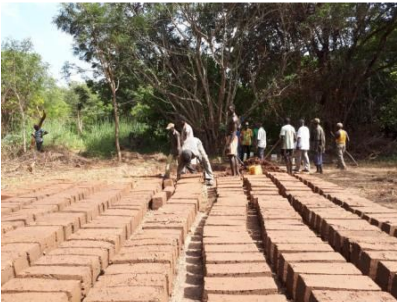
Los jóvenes del pueblo preparan los ladrillos para la construcción de las nuevas casas en Bofa.

Mientras está leyendo este artículo, una cincuenta de familias está reconstruyendo su hogar en un punto cercano a la frontera de Guinea Bissau, en la comuna rural de Boutoupa-Camaracounda, en el sur de Senegal. Son víctimas civiles del conflicto de Casamance, que durante la etapa más dura de la guerra tuvieron que huir del pueblo para refugiarse con familias o conocidos en otros pueblos vecinos, en Ziguinchor e incluso en Guinea Bissau. Algunos llevan treinta años viviendo de prestado en casas de familiares y conocidos, cuya solidaridad se desgasta conforme la situación se alarga por meses y años; entonces, inician un periplo de casa en casa, rehaciendo de nuevo un lugar donde vivir. La situación de la población desplazada y refugiada de Casamance es singular: la guerra por la independencia del MFDC en Casamance ya no figura en los mapas, ni en las agendas internacionales, ni (sorprendentemente) prácticamente tampoco en la agenda nacional. Es un conflicto (con unas víctimas) enterrado, que molesta a la imagen de estabilidad política que exporta el país, y que sólo de vez en cuando se hace notar, aunque no lo suficiente como para constituir una prioridad