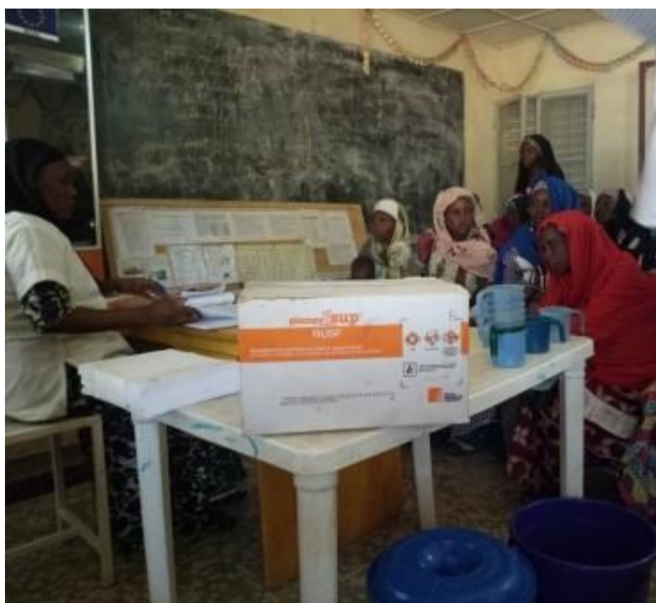
Consulta de nutrición infantil.

Esta emergencia prolongada en el tiempo está afectando de forma severa a la población local, así como a las personas desplazadas, las cuales tienen un acceso muy limitado a la tierra, a los bienes agrícolas y no disponen de medios para desarrollar una actividad generadora de ingresos. Asimismo, la situación de estas personas se ve agravada por la inseguridad que existe en la región, especialmente para las mujeres y menores, que sufren violencia sexual, abusos físicos y psíquicos, secuestros, explotación e inseguridad jurídica entre otros. Además, los servicios básicos de salud y educación de la región tampoco funcionan con normalidad por la inseguridad y