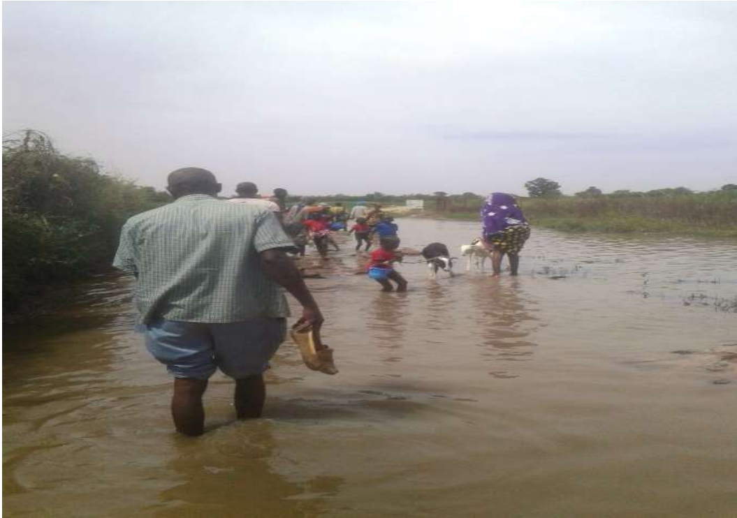
CAMINO PARA ACCEDER AL POZO DE SIRIMOULOU CIRCULO DE KAYES