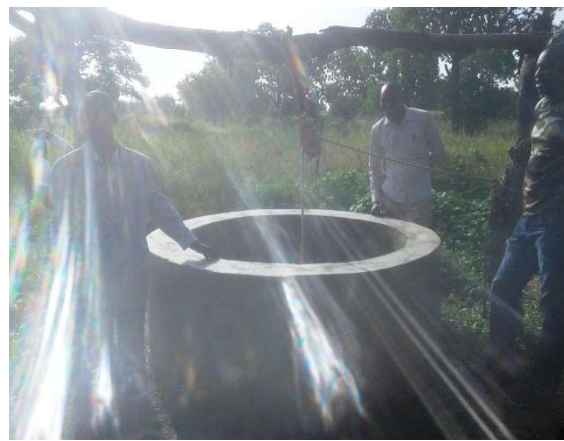
POZO A GRAN DIÁMETRO DEL PROYECTO

Estos cambios importantes son fuertemente apreciados por las comunidades locales y las autoridades acostumbradas, administrativas y técnicas (alcaldes, mandando de círculo, subprefectos, jefes de pueblo, etc.). También generan un impacto que importa al nivel del cambio de comportamiento que conduce a un concientización sobre la realidad del cambio