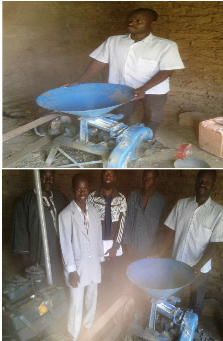
MOLINO DEL PUEBLO DE SEKONA, FLEJADO POR KAYES

Es importante señalar que este proyecto ha sido ejecutado en colaboración directa con AOPP sección de la región de Kayes que en asegurado la ejecución en el mismo sitio. La intervención ha sido concebida con el fin de sostener y de dar una continuidad a la estrategia de AOPP conforme a las leyes y los reglamentos vigentes y a las acciones locales en materia de seguridad alimentaria y en materia de fortalecimiento de la resiliencia comunitaria en las zonas vulnerables. Esta propuesta ACPP y AOPP se apoya en 4 tipos de estrategias y políticas de desarrollo nacional, regional y local: