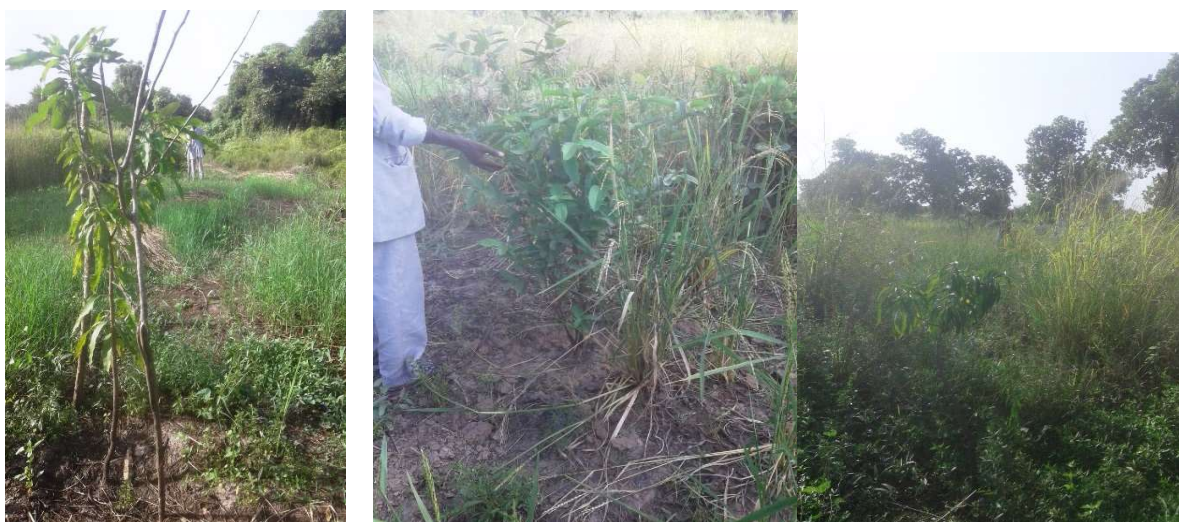
ZONA DE REFORESTACION DE SEKONADANS LA REGIÓN DE KAYES

Con relación a la repoblación forestal, habría sido más juicioso de implicar mejor el servicio de abastecimiento de aguas y Los bosques en la elección de los sitios y de las especies que plantan sobre todo que se observa la vuelta de ciertas especies arbustivas en la zona como las acacias. Estas plantas son caras generalmente más resistentes a los choques climáticos y pueden servir de forraje para los animales y también producen la goma arábica. Actualmente, a causa de su vuelta en el espacio de Kayes, Mali es ánimo de situarse como país exportador de este producto fuertemente apreciado por las sociedades farmacéuticas y cuyo árbol no pide mucho mantenimiento.