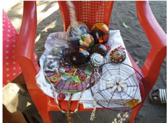
Materiales de artesanas, Tasajera