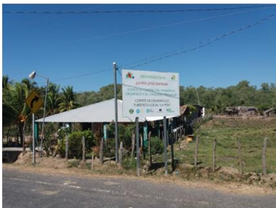
Cartel informativo entrada en La Pita, con logos identificativos del proyecto.