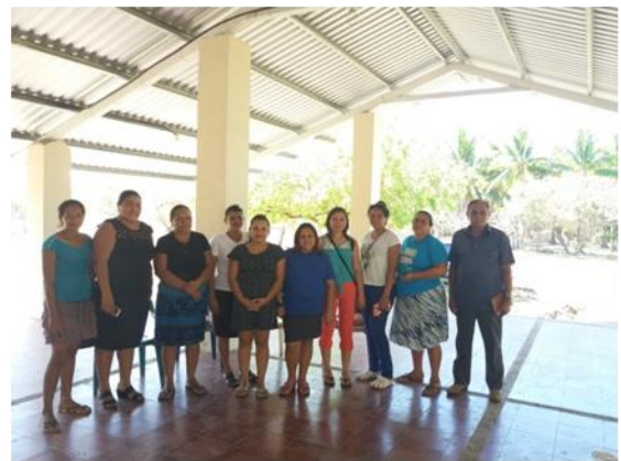
Reunión con el CDT La Pita