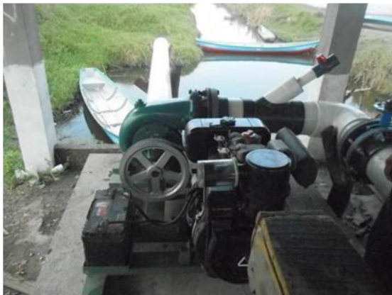
Motobomba de Chinandega