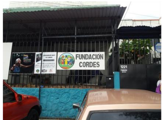
Reunión en la sede de CORDES, San Salvador