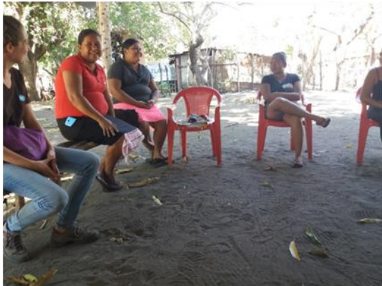
Reunión con grupos artesanas, Tasajera