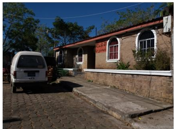
Visita y reunión con Rtv Izcanal.