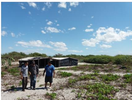
Visita corral de tortugas, Tasajera