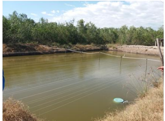
Visita estanques de Las Bordas