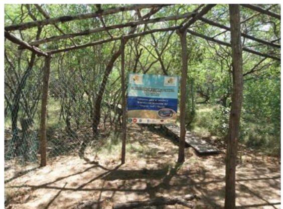
Visita al corral de cangrejos, Tasajera. Cartel informativo y sendero de entrada.