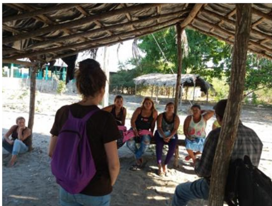
Reunión con Estrellitas del Mar