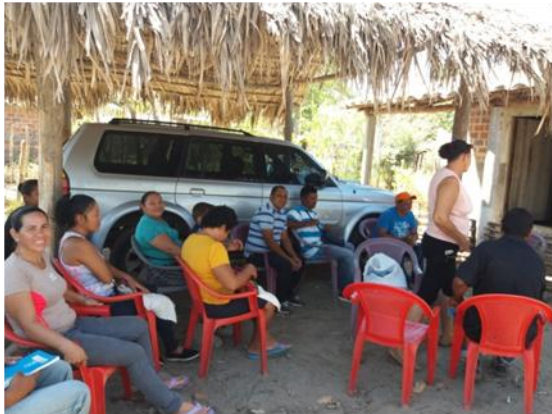
Reunión con cooperativas acuícolas