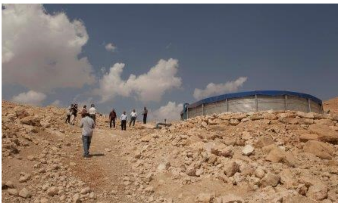
Proyecto de agua en Palestina ejecutado por ACPP y PGH (Palestinian Hydrology Group)

La política de cooperación al Desarrollo de Valencia ha dado un vuelco estos últimos cuatro años pues antes de 2015 era muy deficiente, no tenía calidad ni disponía de dotación presupuestaria que la acompañase. Desde el Ayuntamiento se ha apostado, en esta legislatura que ahora acaba, por darle señas de identidad propia a la cooperación valenciana.