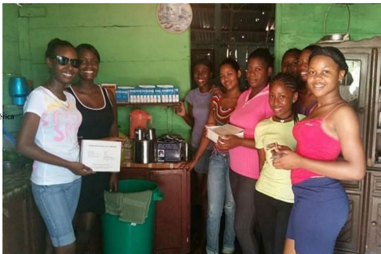
Promotoras de salud del Batey La Balsa en el hogar comunitario de salud

xualizadas para el consumo del varón. O el culto al físico, el maquillaje y la "buena presencia" de las mujeres, habitual incluso en las ofertas de empleo. Y el acoso callejero que se manifiesta a través de los piropos, expresiones que agreden, minimizan, cosifican y desvalorizan a las mujeres, expresiones callejeras que son vistas como cotidianas y pasa desapercibido su verdadero significado. Todo este contexto exige un cambio de modelos y patrones discriminatorios contra las mujeres que garanticen que mujeres y niñas