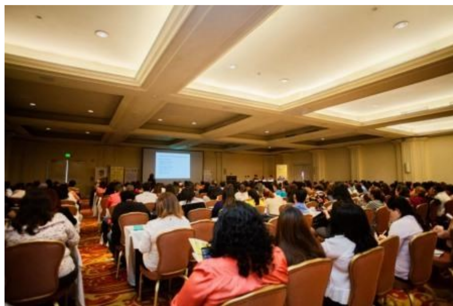
Una de las sesiones celebradas durante el seminario.

Actualmente, y como principales líneas de trabajo, llevamos a cabo el fortalecimiento de las capacidades del sector público a diferentes niveles, apoyando la aplicación de la legislación vigente en la materia con acciones que van desde lo nacional, con el trabajo con el Ministerio de Justicia y Seguridad Pública y la Policía Nacional Civil, a lo local, con el apoyo a corporaciones municipales y la coordinación local en su lucha contra la violencia machista. También hay un