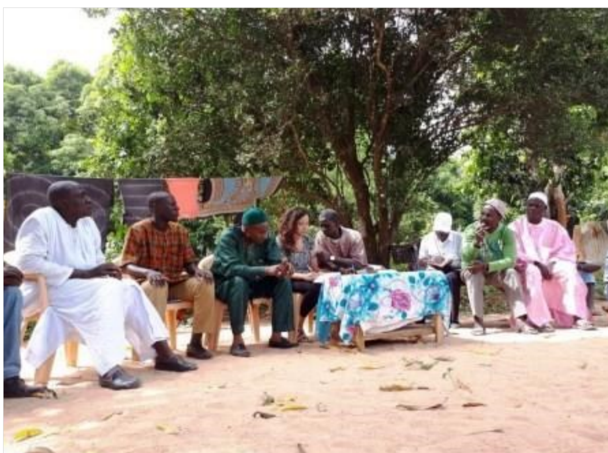
Reunión de inicio de proyecto con los habitantes de Guidel Bambadinka y el equipo de la contraparte senegalesa CRSFPC/USOFORAL

Ya no formo parte del fantástico equipo de ACPP en Senegal, pero ellas siguen trabajando para que los proyectos sigan en marcha, cambiando vidas, creando un mundo más justo. Y eso es lo que cuenta. ●