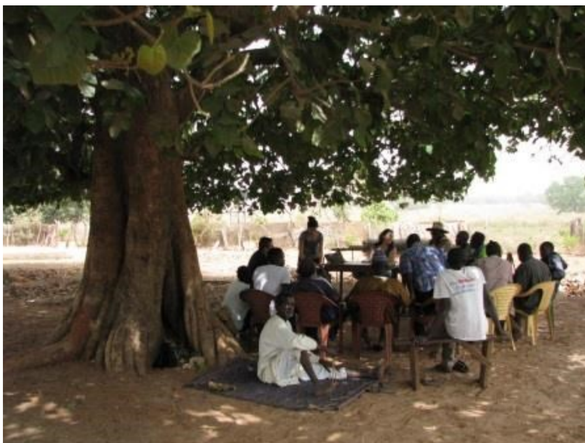
El equipo de ACPP y los socios en un momento de la sesión de trabajo con el equipo de AJAC Kalounayes

Nuestros socios visitaron la sede – granja de nuestra contraparte AJAC Kalounayes en la Casamance, donde tienen un vivero de especies hortícolas y forestales, establos para vacas y pequeños rumiantes, y una despensa farmacéutica veterinaria. El equipo de animadores de AJAC acompañó a los técnicos y les explicó el tipo de trabajo que realizan, sus dificultades, prácticas tradicionales