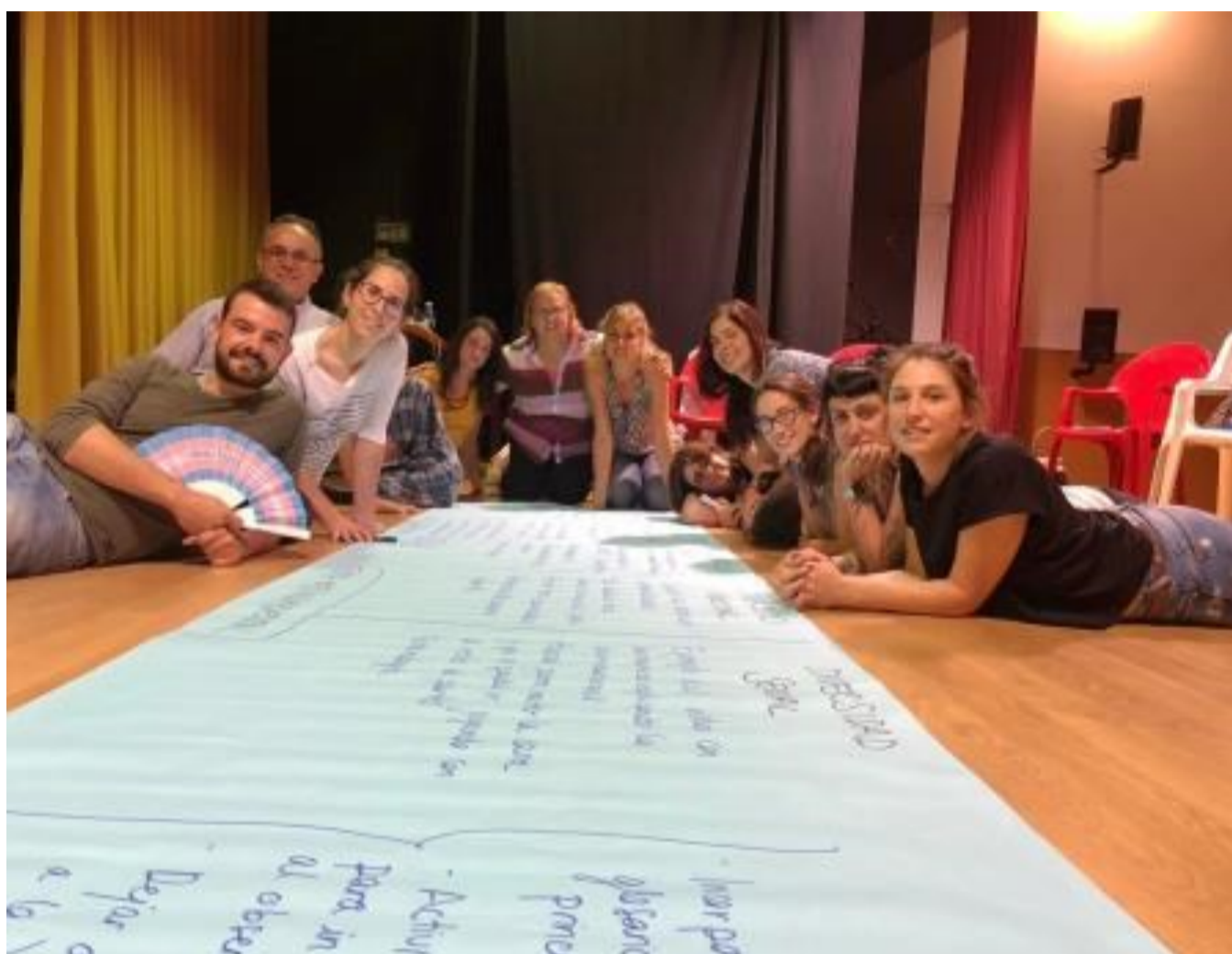
Las personas participantes en el encuentro para renovar el Veó Veó